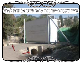
דינים בוקעים בעינור ניקו, מחוץ פירצה אל מחוץ לעירוב

והנה אם הצוה"פ היתה עוברת על מקום שהתעלה עמוקה, הדין תלוי, אם התעלה עמוקה י' טפחים, היא נחשבת פירצה ע"פ המבואר בחו"א (סי' ק"א סק"א). [ובאחרונים דנו האם הבעיה רק במקום שבתוך התעלה, או שהצוה"פ נחלקת לשנים ונפסלת לגמרי, משום שישני העמודים שלה נמצאים כביכול בשני מקומות, ובכל צד אין צוה"פ שלמה]. אבל במקרה שהתעלה אינה עמוקה, והיא פחות מ' טפחים, אינה פוסלת את צוה"פ מעיקר הדין. משא"כ במקרה הנ"ל שהצוה"פ עברה על הכיסוי שמעל התעלה [במקום שהתעלה עוברת בתוך צינור בטון, כפי שמופיע בתמונה], אין לצוה"פ בעיה כלל, כיון שהיא על קרקע ישרה, והיא מחיצה כשרה.