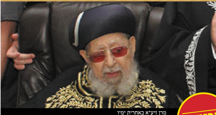
מרן זיע"א באחרית ימיו