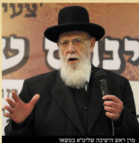
מרן ראש הישיבה שליט"א במשא

כינוס עולם התורה - מעמד חיזוק אדיר ומרומם נערך באולמי בית ישראל בירושלים בהשתתפות מרנן ורבנן גדולי התורה וראשי הישיבות, בראשות מרן ראש הישיבה חכם שלום הכהן שליט"א. המעמד התקיים בימי החנוכה, ע"י "צעירים" איגוד