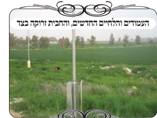
העמודים והלחיים החדשים, והחבית וזוקה כבד

בעקבות הבדיקה החליט ראש הישיבה עם צוות הישיבה, שצריך להקים עירוב חדש ממש, ברמה שכונתית מהודרת, כי לבחורי הישיבה צריכים כשרות מהודרות ממש, יותר מרמת הכשרות של שאר המושב. בתחילה היו קשיים לבצע את התקנת העירוב חדש, והמוקד הציע להם שיקחו בעל מלאכה שיעשה ע"פ התכנית ששירטט מוקד העירוב, אבל ראש הישיבה אמר שהוא רוצה שגם ההתקנה תהיה ע"י מוקד העירוב, כי לכל דבר צריך את המומחיות שלו, ובעירוב מהודר המומחיות היא בחלק ההלכתי, ואת המומחיות הוא אין לבעל מלאכה אחר.