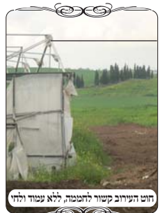
חוט העירוב קשור לחממה, ללא עמוד ולחי

לאחר מכן המשיכו והגיעו למקום שהחוט היה קשור מעמוד העירוב לחממה, ומהחממה המשיך הלאה. שאל אותו הבודק איך העירוב ממשיך. והאחראי ענה בפשטות שהחוט