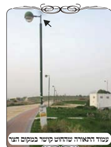
עמוד תאורה שהחוט קשור סביבו במקום הנ"ל

נחזור לענין הישיבה הנ"ל. לפני הרבה שנים הישיבה עשתה עירוב סביב מתחם הישיבה, שחלק ממנו נעשה כצורת העירוב הנהוג במושב שם, ע"י עמודים שעמודים בתוך חביות, באופן שהחבית יכולה לשמש ללחי, וחלק ממנו ע"י קשירת החוטים לעמודי תאורה. בעמודי תאורה מסוג זה, קשירת החוט היתה מן הצד, והרי חוט מן הצד פסול (שו"ע סי' שס"ב סי"א), ובכל זאת כיון שיש בעמודים האלו צואר צר, והיינו שהחלק התחתון רחב, ובחלק העליון מחובר צינור צר, א"כ כאשר קושרים את החוט מסביב לצינור הצר, יוצא שהוא יושב מעל גבי החלק הרחב, וזה כשר כדן חוט שיושב מעל עמוד, (כמבואר בחו"א סי' ע"א סק"ב), ונוקטים שבוה גם המושג"ב סי' שס"ג ס"ק ס"ד) מכשיר]. אמנם בצורה כזו יוצא שכל נדנדוד קטן בחוט, מעורר שאלה הלכתית קשה של חוט המתנדנד ברוח.