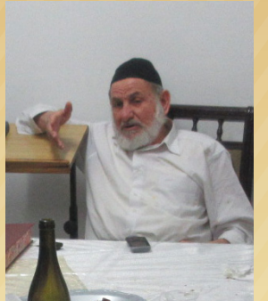
"חוק הגיוס נועד לפגוע בעולם התורה הספרדי ומחובתינו למחות על כך!"

יהי רצון שמרן זיע"א ימליץ טוב בעדנו, וזכותו