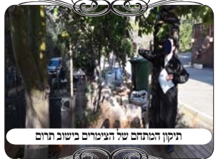
תיקון המתחם של הצימרים בישוב תרום

ביום שיש האחרון היו כמה שהתקשרו לשאול על החצר של הצימר, מכמה יישובים מהצפון ועד הדרום, אחד מהם היה בישוב "תרום" באזור בית שמש, שידוע שאי אפשר לסמוך על הישוב, ולכן כמה משפחות או מסורתיות מהיישוב