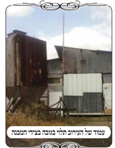
עמוד של העירוב תלוי בגובה בעירוב הנבחר

בימי בין הזמנים, לאחר חג הפסח, יצא הבדוק לדרכו ועבר באחד הישובים ליד קוממויות. מתוך סקרנות הוא בדק האם העירוב עשוי בצורה מסודרת ונכונה, או ברמה בעייתית. כלומר, יש מקומות שהעירוב בנוי בצורה גרועה, שעובר מעל גדרות ומעל מחסנים, והחוטים שוקעים בצורה מוגזמת. בעירובים כאלה צריך תשתית חדשה ואין הרבה מה לעשות. ויש מקומות שהעירוב בנוי בצורה מסודרת, שהעמודים בצורה תקינה, עם ראש נכון, והוא עובר מחוץ לגדרות ולמחסנים, ואינו כולל שדות זרעים. אלא שגם בהם מצוי שבמשך הזמן השתנה משהו כשבוניס דירות ומחסנים בכמה מקומות, או שנפל עמוד ועשו פתרון לא נכון, ובהם התיקון לא גדול, ואפשר ללמד את האחראי לעשות תיקון נכון. בשביל מקומות אלו המוקד עובר בישובים, לדבר עם האחראים וללמדם את ההלכות, לבדוק ולהסביר כיצד לעשות.