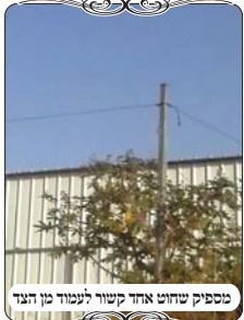
מספיק שחוט אחד קשור ללמוד מן הצד

לעומת ההתקדמות הגדולה אצל רבים, כבר נכתב בגליון הקודם, שאנשים שוכרים דירות לשבת בישובים נידחים, ומכניסים את עצמם ואת בני משפחתם למצבים של ספק חילול שבת רח"ל, משום שבישובים רבים אי אפשר שיהיה שם עירוב טוב, ואפילו עירוב ברמה מינמלית אינו קיים בהרבה מהם. וגם אם מלכתחילה עשו עירוב טוב אין אדם מוסמך שאפשר לסמוך שהוא בדיק כהלכה, משום שבדרך כלל הרב אינו בודק בעצמו, אלא מונה אדם מן הישוב שלא עסק מעולם בהלכות, ואומר לו רק שידא שיהיה חוטים, מבלי ללמד אותו את פרטי ההלכות ולכן מוצאים לפעמים שחלק מהחוטמים הוא קשר מן הצד. ומספיק שחוט אחד מכל העירוב קשור בצורה פשוטה, וכבר כל העירוב אינו כשר. כיון שהריקף שאינו מושלם, נעשה כרמלית ואסור לטלטל בו יותר מד' אמות. וזה דבר שיכול להיות במשך כמה שנים, כי אף אחד לא חושב שצריך לעקוב אחרי הבודק, וללמד אותו לקשור חוט כהלכה. והמכשול בזה גדול מאוד.