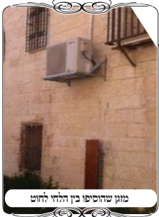
מזוג שהותקן בין הלחי לחוט

דוגמה אחת של העירונית המיוחדת שנדרשת בעירובים המהודרים, שלח אלני הגאון רבי מאיר רוזנר שליט"א, על מנת שנפרסם את הדבר בגליון, ללמד בו את כלל האחראים ברחבי הארץ, לדעת להבחין בבעיה מסוג כזה. באחד המקומות היה חוט קשור לקיר הבנין, ולחי מברזל מחובר היטב מכוון תחתיו.