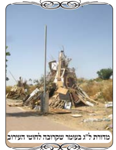
מדורת ל"ג בעומר שקרובה לחוטי העירוב

בשבוע זה חל יום ל"ג בעומר במוצאי שבת, ובכל הערים הילדים זריזים ומקדימים להעמיד את המדורות על תילם כבר כמה ימים לפני שבת, שיהיו עומדים ומוכנים לשעת ההדלקה. ולכן אנשים התקשרו ושאלו, האם השבוע לא כדאי לסמוך על העירובים, מחשש שתהיה תקלה סמוך לשבת שלא יבחינו בה, או שהאחראי לא יוכל לעמוד בכמות הקלקולים.