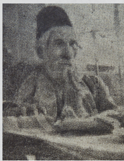
הגאון הצדיק המקובל מהרש"א אלפנדר זצוק"ל

בימי ספירת העומר עת אשר נוהגים ישראל קדושים ללמוד משניות מסכת אבות, מצאנו בספרו של מרן זיע"א 'ענף עץ אבות' מעשה נורא מהגאון הצדיק המקובל מהרש"א אלפנדר זצוק"ל שהוא אקטואלי במיוחד לימינו אנו, כאשר לבושתינו ולחרפתינו אנשים משולי הציבור החרדי פועלים לגייס את בחורי ישראל לצבא בניגוד לדעתם ולהוראתם של כל גדולי ישראל זיע"א ויבלחט"א. על כן ראינו לנכון להביא את הדברים בפני הציבור הקדוש ואולי ילמדו תועים בינה וישונו מדרכם הרעה: