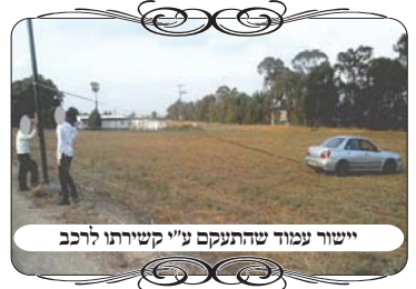
יישור עמוד שהתעקם ע"י קשירתו לרכב

בעבודות תיקון העירוב הזה, היו עמודי תאורה גדולים, שהחוט של העירוב היה קשור מעליהם [ולא מן הצד], אבל הם התעקמו במשך הזמן 10-20 ס"מ, וממילא יוצא שהחוט של העירוב שיושב על ראש העמוד הנוטה, לא עובר מעל החלק התחתון של העמוד. בדין זה ידוע שהחכמת שלמה (להג"ח"ש קלוגר זצ"ל בגליון השו"ע סי' שס"ב ס"א) אוסר, והחז"א במסקנתו (פי' ע"א ס"ק י"א) ג"כ כתב שאין מקור נאמן להכשירו, וכן הורה למעשה שלא להתיר עמוד עקום (קריינא דאיגרתא) [ומדברי השעה"צ (פי' שס"ג ס"ק י"א) אין ראייה להתיר עקום לצד, אלא רק לכיוון החוט]. הבודק אמר להם שאמנם בעירובים עירוניים ובמושבים מבליגים ע"ז, ואין כאן טענה על האחראי של המושב, אבל זה לא עירוב שמתאים למקום חרדי, ובכל העירובים