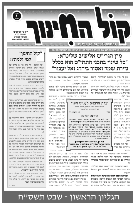
הגליון הראשון - שבט תשס"ח

אומר ועושה. לאחר התייעצות נוספת וקבלת ברכתם של גדולי התורה שליט"א, החל גליון "קול החינוך" לצאת לאור בתדירות חודשית, וב"ה אשר הגענו עד הלום כאשר זכינו להגיע לגליון המאה! האם שינה "קול החינוך" את המצב? האם מנע את ההתדרדרות? התשובה היא לצערנו ולדאבונו: הן אמת שבמשך כמעט 10 שנות הוצאתו לאור של