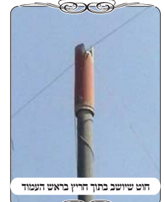
חוט שיושב בתוך חריץ בראש העמוד

מקרה אחר שהיה בישוב אחר שנבדק השבוע, שגם שם היו עמודי עירוב רגילים, ופתאום באמצע היו שלשה עמודים עם ראשים אחרים. בעמודים אלו הוסיפו מעל העמוד צנור שבראשו יש חריץ בעומק חמשה סנטימטרים, והחוט יושב בתוך החריץ. דהיינו במקום להוסיף ברזל כעין v מעל העמוד, עשו חריץ שהצדדים של הצינור ישמשו כעין אותו רעיון. הנה במבט פשוט זה נראה פתרון טוב, והוא גם חסכוני יותר קל, לעשות חריץ במקום לרתך כיפה. עם ברזל מנוסף בצורה מיוחדת. אבל כשמעיינים בהלכה מגלים שהפתרון הזה לא פשוט, עד כדי שלדעת כמה פוסקים אין להכשירו.