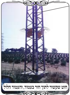
חוט שקשור לתוך חור בעמוד, והעמוד חלול

מעל גבי העמוד, ודאי שגם כשהחוט מושחל בחור הוא פסול, שהרי העמוד ממשיך ועולה מעליו. אבל לפי דברי החו"א יש אומרים שהוא כשר, כי גם בזה ניתן לומר דל מהכא את החלק שמעל החוט שאינו צריכים אותו לעירוב, וכביכול העמוד מסתיים מתחת החוט. אמנם יש מפקקים בזה ואומרים שהחו"א התיר רק במקרה של המש"ב שהעמוד אינו ממשיך מעל החוט ממש, אלא רק בצדדים, וע"ז שייך לומר דל מהכא, כי באמת מקום החוט הוא העמוד האמיתי. [וע"ש בחו"א בסו"ד דה"ה אם תחב באמצעיתו, כשר].