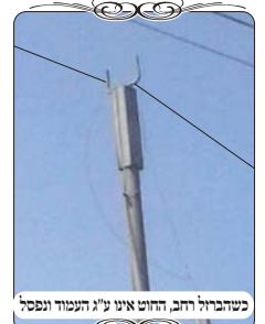
כשהברזל רחב, החוט אינו ע"ג העמוד ונפסל

נביא שתי דוגמאות מהדברים שעברנו בשבוע זה. באחד הישובים היו אנשים טובים שרצו לעשות עירוב למושב, אבל לא היה להם תקציב, ולכן החליטו שהמושב יתן רק את החומר [עמודי הברזל]. ואת העבודה יעשו בעצמם. הם קראו לרב שיתן להם הוראות באופן כללי, ולפ"ז עשו. כעת כשעברו הבודקים של המוקד, הם ראו שחלק מההיקף עשוי בצורה רגילה, ובחלק מההיקף יש עמודים עם ראשים בצורה משונה. מעל העמוד העגול הרכיבו פרופיל [צינור ברזל מרובע], ובמקום לעשות לו v נהוג, הם עשו לו כעין צורת ח הפוכה, והיא רחבה יותר מהעמוד, והקצוות שלה אינם מעל העמוד. במצב כזה כל צורה שיקשרו את החוט, זה יהיה פסול! משום שאם יקשור לברזל העמוד, הרי הוא מחוץ לעמוד, והרי זה צורת הפתח שהחוט מן הצד, והיא פסולה (שו"ע סי' שס"ב סי"א). ואם יניח את החוט בין שני הברזלים [כמו שמניחים בעמוד שיש לו v], הרי החוט יימשך לצד בשעת המתיתיה או בשעת הרוח, והוא לא יהיה מעל העמוד. ואין אפשרות להכשיר את העירוב במצב כזה כלל.