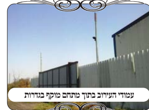
עמודי העירוב בתוך מתחם מוקף בנדרות

הנהגה שהתנדב מעצמו לנסיעה זו, על מנת לסייע בבדיקת הישובים, התעניין בחלק ההלכתי הנ"ל, וביקש מהבדוק שיסביר לו את הבעיה. בתוך כדי כך הבחין הנהגה שיש כאן בעיה נוספת, שפוסלת בין למשנ"ב ובין לחזו"א, מפני שכל העמוד הזה נמצא בתוך מתחם מוקף בעמודים (סי' שמוקף לעצמו, וכתב המשנ"ב (סי' שס"ג ס"ק ק"ג) שלא כלום הוא, ואפילו אם רק עמוד אחד נמצא בתוך מקום מוקף, העירוב אינו מועיל. וכן הסכים החזו"א (סי' ע"א ס"ק כ"ב) במקרה כזה. וא"כ מסיבה זו לבד נפסל העירוב. הבודק ציין לשבח את עירונותו של הנהג, שע"י הסיוע שלו בבדיקת העירובים כמה פעמים במשך השנה האחרונה, הוא למד להבחין בעצמו בהלכות הנוגעות לכשרות העירוב.