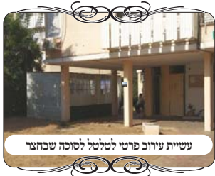
עשיית עירוב פרטי לטלטל לסוכה שבחצר

מוקד העירוב השכונתי בני ברק 054-84-83-320