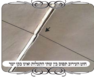
חוט העירוב תפוס בין שתי התעלות ואינו בקו ישר

שאלה נוספת ממשפחה בבני ברק שעשתה צורת הפתח מתחת בנין, כיון שלא היו מחיצות מסביב לחצר, וקומת קרקע היתה קומת עמודים, לכן הקיפו חלק מהחצר ע"י צורת הפתח. והנה החוט שעבר תחת הבנין היה מידי נמוך, וגם הוא לא נמתח להם בצורה טובה, ובמקום שעיבר השביל שבו נכנסים לבנין ירד החוט ושקע כלפי מטה, עד כדי שהפריע ליוצאים והנכנסים לבניו. בתחילה הם התקשרו לשאול האם אפשר לקשור את אמצע החוט לתקרה, והמשיב ענה שיש בזה בעיה שהחוט יוצא בצורה מזוגגת, כעין שתי קשתות כלפי מטה. לאחר מכן הוא הסתפק בתשובה זו, האם חוט ששוקע בצורה כזו של שתי קשתות, גרוע יותר מחוט ששוקע שקיעה אחת ארוכה מעמוד לעמוד, ועיין בזה.