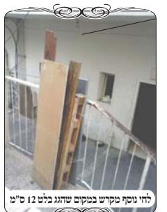
לחי נוסף מקרש במקום שהגג בלט 12 ס"מ

בשנה זו העלה מוקד העירוב חידוש מעניין בענין הסוכות הפוסלות את העירובים, והדבר הובא להכרעה לפני רבני העירובים. יש דין שאם בין הלחי לחוט יש גג הבולט ומפסיק, הוא פוסל את הפתח, כיון שיסוד הענין של לחי שרואים אותו כאילו עולה ומגיע עד החוט, וכאשר הגג מפסיק בניהם, אין אומרים גוד אסיק, ויוצא שהחוט שהוא המשקוף, אינו נמצא מעל העמודים (משנ"ב סי' ש"ג ס"ק ק"ב). לפ"ז יש מקרים שגג הסוכה נפתח ובולט לרחוב במקום שנמצאת צורת הפתח של העירוב. והנה אם הגג נמצא בקומה גבוהה מעל החוט של העירוב, הגג אינו פוסל את צורת הפתח, כי אינו מפסיק בין הלחי לחוט, [מלבד מקרים שיש פין די תקרה במקרים שיש שני צדדים קירות ואכמ"ל]. אבל במקרים שהגג יוצא למטה מהחוט, הוא מפסיק בין הלחי לחוט וא"כ הוא פוסל את הפתח. באחד המקומות האלו בבני ברק, בא האחראי בחול המועד סוכות, ועמל במשך זמן ארוך להעמיד לחי נוסף מקרשים שיעמוד רחוק 12 ס"מ מלחי הברזל, במקום שהגג נגמר. לאחר מכן הוא בא בשבת לראות את הלחי, והבחין שהשכן סגר את הגג לשבת, ולא היה צריך לעמוד בהתקנת הלחי הנוסף.