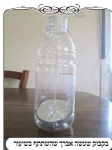
בקבוק שעשה אברך שהשתתף בשיעור

האחראי קיבל את האפשרות השניה [שבדרך כלל זה פתרון המקובל בכל מקום], וחיפש ומצא קרשים בגודל המתאים, אלא שעדיין לא היה לו את המכשיר למדידת מקום החוט, ושוב ביקש שהמוקד ישלח מישוהו להדריך אותו היכן להעמיד את הלחץ. כמובן שלא שייך לשלוח נציג לכל אחראי שצריך למדוד מקום של חוט, בשביל זה נערכו שיעורים בחודש אלול בכמה מקומות ללימוד המדידה, וכן ניתן לרכוש את הבקבוק מיוצר ע"י מוקד העירוב, כדי שכל מי שצריך לכך יוכל ללמוד ולמדוד בעצמו בשעת הצורך. כמו"כ היו אברכים שלאחר ששמעו את השיעור ואת ההדרכה, עשו בעצמם בקבוק עם שרשרת, והתיעצו עם המוקד לדעת שעשו כמו שצריך. אבל במקרה שהאחראי לא למד את המדידה, הוא באמת בבעיה. ולכן חשוב שכל אחראי ידע את אחד מדרכי המדידה.