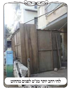
לחי רחב יותר מג'מ"ט לפני מהחווה

שבמקרים רבים משתמשים בקרש גדול. בשנה זו היתה משפחה שהשתמשה בדופן של סוכה שנשארה מיותרת, והחוט היה קשור קרוב לצד החיצוני. והלחי בלט כלפי פנים חצי מטר. כמוכן שהדבר אינו נעשה בכוונה אלא מחמת חסרון ידיעה, אבל צריך לדעת לשאול ולברר כל דבר, כי ההלכות הן מורכבות, ולא מספיק לדעת מהו לחי בשביל לעשות עירוב.