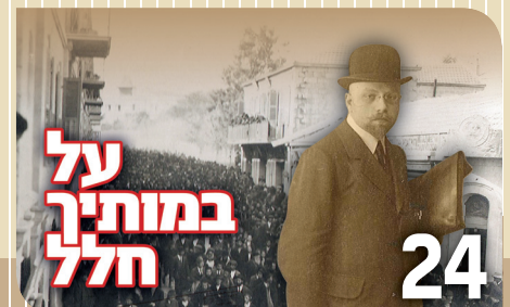
24 על במותיך הלל