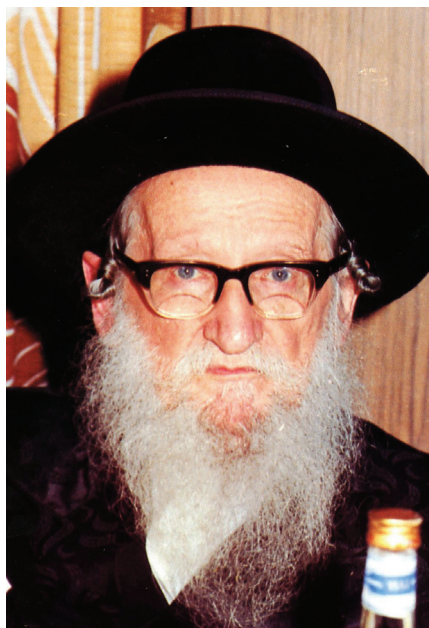
מרן בעל המנחת יצחק זצוק"ל

בחודש אייר תשל"ח, יצאה משלחת מחברי הנהלת העדה החרדית לדרכה. בחמימות וחיבה מובלטת קבל מרן הגה"ק מסאטמאר זצוק"ל את פני המשלחת הנכבדה ויהי כשמעו את דבר שליחותם - הוטב הדבר בעיניו והוא הביע על אתר הסכמה נלהבה תוך שהבטיח, כי תיכף אחר חג השבועות יפתחו ההכנות.