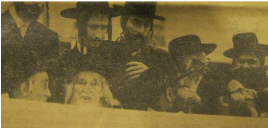
מרן הגה"ק מסאטמאר זצוק"ל במעמד יסוד קרן הצלה