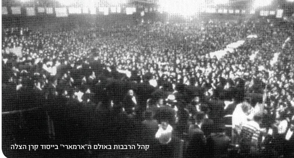
קהל הרבבות באולם ה"ארמארי" בייסוד קרן הצלה

לעת מבוכה כזאת, עלו ראשי העדה החרדית בירושלם לדון בדבר עם מרן בעל מנחת יצחק זצוק"ל - ראב"ד ירושלם תובב"א באותם הימים, ופרשו לפניו מצבם הקשה של מוסדות התורה והחינוך הטהור, שהתערור צורך דחוף לנתינת מענה הולם, קבוע ורצוף להבטחת קיום וביסוס המוסדות באופן רצוי ונאות ובדרך כבוד, ועלתה הצעה שנראתה בגדר "חלום". והיא: הקמת קרן כספים המתבססת על תרומות של נדיבי עם בארץ ובעיקר מהגולה, למען תחזיק ותתמוך באופן קבוע בכל אותם מוסדות התורה המדירים עצמם מן התמיכה