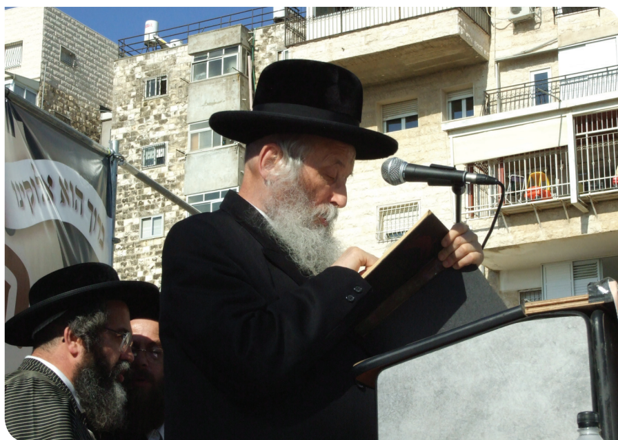
מרן גאב"ד ירושלם שליט"א נושא דברים במעמד 'קרן הצלה', כ' סיון תשס"ח