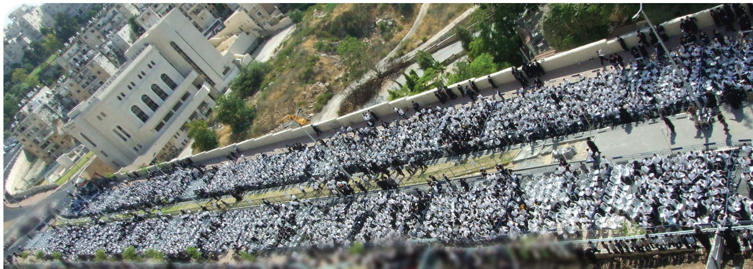
אלפי ילדי התשב"ר על טהרת הקודש במעמד 'קרן הצלה' - כ' סיון תשס"ח

בפרוס חג הפסח תשל"ח חלקה הממשלה את הכספים לישיבות והכוללים בסך כולל של שלושים ושנים מליון לירות!