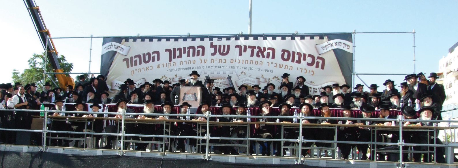
במת הכבוד במעמד במעמד האדיר לציון 30 שנות התייסדות "קרן הצלה" - כ' סיון תשס"ח

על שכמם חברי הביד"ץ, לטובת מוסדות הקודש הסרים בנאמנות לשיטת והוראת גאוני וקדושי קדמאי נבג"מ, ולהבל"ח גאוני וקדושי זמננו שליט"א.