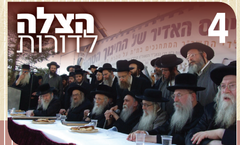
4 הצלה לדורות

והשי"ת יזכנו לדבוק בדרך האמת ולא לפנות אל ההבים ושטי כזב, עדי ישלח לנו את משיח צדקינו במהרה בימינו, אכי"ר.