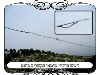
חיש פתחי שימאי בקשרים בחוט

הנה יש שרוצים לדון בחיבור של שני חוטים, שיש חשש של פתחי שימאי במקום של חיבור החוט, כיון שהחוט הוא "משקוף" של הפתח, וגם במשקוף יש דין שיהיה ישר ולא פתחי שימאי (כמו שמצינו בכמה פוסקים (רע"א, משכנות יעקב, חזו"א) שדנו על דברים בחוט שהם פתחי שימאי), א"כ כאשר יש בליטות וזנבות בחיבור החוטים, יוצא שהמשקוף אינו ישר, [ויתכן שיהיה תלוי אם הקשר בולט כלפי מטה שהוא מקום המשקוף, או בולט כלפי מעלה שאז אינו נוגע