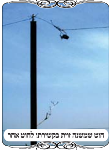
חוט שמשנה זזית בקשירתו לחוט אחר

שכנגדו, ויצא שהחוט יורד כלפי מטה וממנו ממשיך כמשקוף. הבודק של מוקד העירוב אמר באופן ברור, שאין להכשיר את המצב הזה. אבל האחראי היה סבור שזה עדין כמשקוף אחד. בשבוע שלאחריו הגיע לשם אחד מגדולי העושים בעירובים עירוניים, שיודע להקל הרבה, ובכל זאת הורה לו שהמצב הזה אינו כשר. כיון שהחוט שיוורד כלפי מטה אינו המשך של המשקוף, וכיון שיש כאן שבירה, דהיינו שינוי זזית, אי אפשר להכשירו.