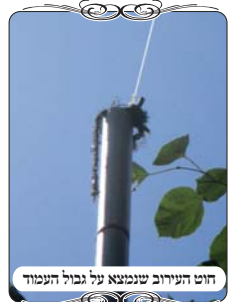
חוט העירוב שנומצא על גבול העמוד

הבודק של מוקד העירוב הוסיף וגילה, שבמצב כזה שהעמוד דק, וראש העמוד אינו עשוי בצורה המקובלת, יכול להיות שינוי קטן שיפסול לגמרי את העירוב, ואפילו אם זה יקרה כך בעמוד אחד מכל העמודים שבעיר, המשמעות שלו היא חד משמעית! הבודק התבונן בראשי העמודים, ובאמת באחד מהעמודים היתה סטייה קטנה בקשירת החוט, שיש לדון שמה היא פוסלת את כל העירוב. אלא שכיון שההבדל הוא כל כך קטן, יש בודקים שלא מייחסים לכך חשיבות.