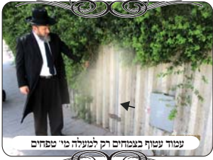
עמוד עטוף בצמחים רק למעלה מ"י טפחים

הנה בנושא של צמחים העוטפים את העמוד יש לדון מצד כמה דינים, ולכל דין יש את האופנים שבו אינו פוסל. א. צמחים העוטפים בחלק התחתון ומגיעים לגובה י"טפחים, יש מקרים שנחשבים למחיצה, והם פוסלים לשיטות האיסרות מחיצה באמצע הפתח, כלומר שהעמוד אינו נמצא בשטח הפתח, ואינו סותם מקצת הפתח. ויש מקרים שמצטרפת הלכה נוספת, באופן שהעמוד צמוד לקיר והצמחים מכסים עליו ועל הקיר, הצמחים נחשבים כמשך מחיצת הקיר, ואז העמוד כביכול בלוע במחיצה, ואין לו דין סתימה כלל, ויש לו עוד טעם להיפסל, משום שהעמוד נמצא אחורי הכותל. בשני דינים אלו, אם החלק התחתון של העמוד עדי י"טפחים אינו מכוסה, אין בעיה כלל, כי עיקר העמוד הוא רק י"טפחים התחתונים, שרק להם יש תנאים של מחיצה [והשאר אפשר גם לומר גוד אסיק, ודל מהכא את החלק העליון (עי' שעה"צ סי' שס"ג ס"ק י"א)], לכן במקרה הנ"ל לא היה חשש מצד שני דינים אלו.