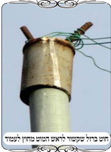
חוט ברזל שקשור לראש המוט מחוץ לעמוד

בישוב המדובר באחד הזוויות של גבול העירוב, היה עמוד דק ברוחב כארבע ס"מ, ועליו היה ברזל (רחב יחסית) שסביבו קשרו את החוט. באותו ישוב השתמשו בחוטי ברזל שאינם גמישים כל כך, ואירע שבאחד מהחוטמים היה כיפוף כלשהו והוא יצא מהצד של העמוד.