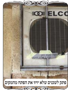
פתח לשכנים שלא יזיזו את הפתח מהמקום

ב. מצד רוחב הפח, הוא רחב יותר מלחי רגיל, ורחבו בצד אחד כחצי מטר, ובצד אחר כשמונים ס"מ. ובענין זה מקפידים על מש"כ החזו"א (סי' ע' ס"ק י"ח בהערה) שהלחי לא יבלוט ממקום החוט ולפנים ג' או ד' טפחים. משום דאפשר דהוי פתחי שימאי. ולכן צריך להקפיד שהלחי לא יהיה רחב מאוד כלפי פנים [לשטח המוקף לעירוב]. ולגבי זה יש