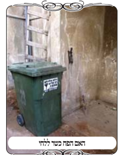
דאב הפח בעיר ללחי