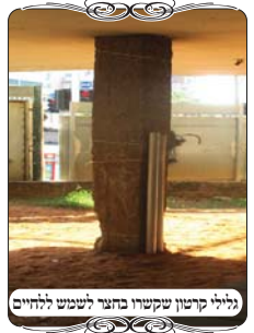
לחילי קרטון שקשור בחצר לשמש ללחיים