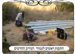
התקנת ראשים לעמודי העירוב החדשים

כמה סיבות שאין להכשירם. כך שלא יתכן שהדבר נעשה מתוך ידיעה, אלא מחוסר ידיעה רח"ל אנשי המקום מצאו את מי שעמד מאחורי ההתקנה, כדי לשאול אותו על איזה דין הוא הסתמך, אבל הוא התחמק מכל אחיות, ולא נותר להם ברירה אלא להתחיל מחדש.