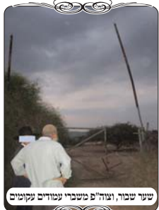
שער שבור, וצו"ח מטשבי עמודים נקטים

בהמשך הבדיקה, שקעה החמה, ועדיין לא השלימו את הבדיקה. אך היה נראה שצריך לסיים, כי עוד מעט יחשיך והם נמצאים רחוק מהבתים