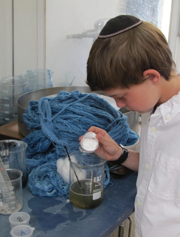
ילדים משתתפים בפעילות של הצביעה