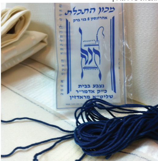
התכלת של ראדזין

שיטתו של האדמו"ר מראדזין, אשר כאמור, על פי דעותיהם של מרבית החוקרים בתחום, הוטעה בידועין על ידי אחד החוקרים, השתכחה בימי השואה