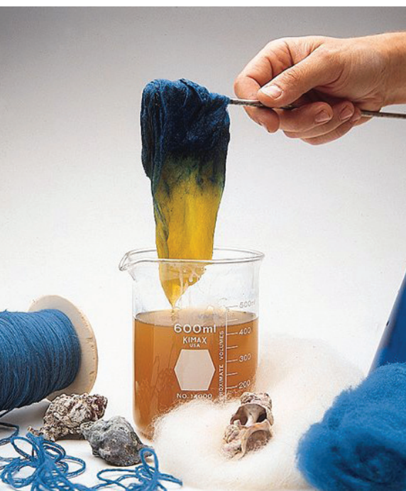
תהליך צביעת הצמר

השיטה הנפוצה כיום, מסתמכת על זיהוי חילזון ששמו ארגמון קהה קוצים. אגב מחקר של הרב הרצוג, גם את הגישה הזאת הוא דחה, בעיקר בשל העובדה שנכשל בניסיונו להפיק צבע תכלת מהחילזון המדובר. במשך שנים רבות נכשלו רבים מהחוקרים להפיק את התכלת מחילזון זה, עד אשר, כפי שמתאר בשיחה ל'יום ליום' אחד הפעילים לחידוש התכלת בימינו, החליט אחד הכימאים לחשוף את הנוזל לאור השמש, וצבעו אכן השתנה.