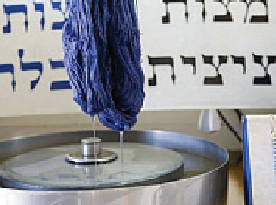
הצמר אחרי צביעות בתכלת

היא כי בגמרא מופיע "תנו רבנן: חלזון זה גופו דומה לים וברייתו דומה לדג ועולה אחד לשבעים שנה ובדמו צובעין תכלת לפיכך דמיו יקרים". תיאורים אלו לא מתקיימים באופן פשוט בארגמון קהה הקוצים.