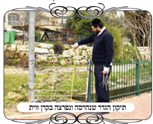
תיקון הגדר שנדרסה ונפוצה בקרן זיית