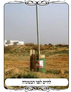
לחיים לפני הבטונדה

ג. אלא שאם הבטונדה גבוהה י' טפחים, לכאורה לא צריך כלום, כי הבטונדה עצמה תחשב כלחי. וגם בזה יש לפקפק א. בעירובים טובים מקפידים שהלחי לא יהיה רחב מאוד, משום שמבואר בחזו"א (סי' ע' ס"ק י"ח בעהרה), שאם הלחי בולט ממקום החוט כלפי פנים ג' או ד' טפחים, אפשר דהוי פתחי שימא.