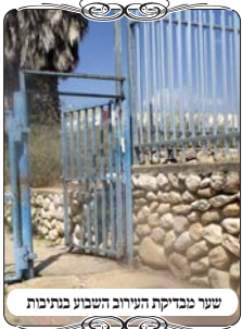
שני מבדיקת העירוב השבוע בנתבות

גם בדיני המחיצות, שבהם מובן יותר שהדינים נוגעים למעשה, אבל המלאכה הגדולה לדעת לראות דבר ולהתאים לו את ההלכות, איזה דין יכול להיות בו. נקח דוגמא אחת (ראה לקמן) שנשאלה בשבוע זה מאחת הערים