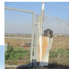
כך נראה הלחי סמוך ליישוב ח. מה דיין הלחי במצב כזה?