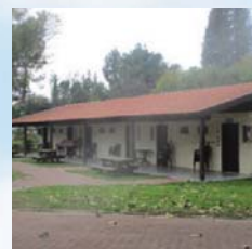
האם יש היתר לסליל תחת הגג?