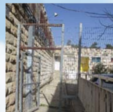
מה הבעיה בפתח הזה, והאם יש אפשרות להיתור?