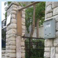
האם העירוב בצימר כשר בצורה כזו?