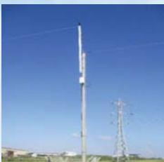
עירוב ליד ישוב חפץ חיים - כשר או פסול?