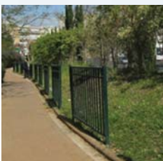
האם ניתן להיתר גדר זו ע"י "עומד מרובה"?