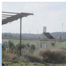
זה מה שהאחראי הראה לנו, היכן העירוב בתמונה?