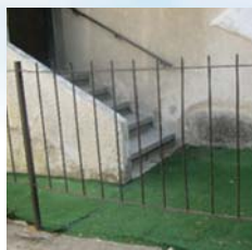
מה צריך לדעת למדוד בגדר זו?