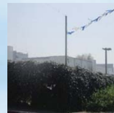
עמוד שמוקף בצמחים, מה דינו לכתחילה ובדיעבד?