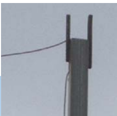
כך נראה החוט בכניסה ליישוב מ. ח, כשר או פסול?