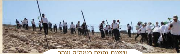
נטיעת גפנים בעיה"ק יצהר

מיצהר נסענו לישוב יקר, תוך שאנו שומעים הסברים על הדרך ומה שיש בה. מיקר יש כניסה לנחל קנה, נחל המוזכר בספר 'הושע כ'גבול' המפריד בין נחלת אפרים לנחלת מנשה. גדות הנחל עמוסים בפרדסי תפוזים ולימונים ובשאר פירות. זאת