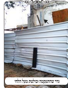
גג שהתעקמה ופוסלת מעל הלחי

גג המפסיק בגדר שהתעקמה במהלך הסיוור הבחינו האברכים שהפועלים השעינו על הגדר ברזלים, וגרמו לה לנטות כלפי השביל, עד כדי שהיא מכסה מעל הלחי (כיון שהלחי צמוד לגדר), וא"כ יוצא שיש גג המפסיק בין הלחי לבין החוט. בשלב זה עצרנו ושאלנו את האברכים האם אכן זה פוסל את הלחי, לפי מה שלמדנו במסגרת השיעורים. האברכים השיבו מיד את תשובותיהם, שיש לדון בזה משני פנים, א. כיון שהעקמימות בגדר נעשית רק בגלל הברזלים שנשענים עליו, והם זמניים כי עוד מעט יצטרכו אותם ויקחו אותם, ואז הגדר תחזור למקומה [לפי המצב במקרה זה], א"כ זה גג ארעי,