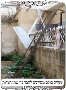
שתי סולמות מסורגים להבר בין שתי חצרות

לפ"ז כאשר רוצים להשתמש בסולמות המצויים בזמנינו נתקלים בכמה בעיות. אבל בני המשפחה הנ"ל שרצו למצוא פתרון לחבר בין שני החצרות, מצאו רעיון מקורי על ידי שני סורגים של חלונות גדולים משומשים שהיו זרוקים באיזה מקום לאחר שיפוץ בית, גררו אותם אל הקיר שבין שני החצרות, העמידו אותם באופן שהברזלים שבתוך הסורג מאוזנים, סורג אחד מצד חצר הבנין ואחד בחצר הישיבה, אחר כך שקשרו אותם עם אזיקונים, ובכך קיימו את כל התנאים. א. רוחב השליבה דהיינו רוחב המוטות שבתוך הסורג הוא יותר מד' טפחים. ג. הסורג היה ארוך והגיע עד ראש הקיר. ג. שני הסורגים היו סמוכים זה לזה תוך ג' טפחים. ד. הסורגים נחשבים כסולם כבד וקבוע, ואף הוסיפו בזה שקשרו אותם על ידי האזיקונים שהם דבר שאין לפותחו בשבת.