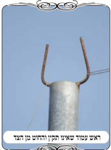
ראש עמוד שאינו תקין והחוט מן הדג

במסגרת הפעילות לבדיקת ישובים, נתבקשנו לבצע תיקון בישוב מסוים באזור העיר אשדוד. בעקבות זאת נסענו אל הישוב לראות את המצב הקיים, ולבדוק מה צריך לתקן בו. עברנו בסקירה מהירה סביב לישוב, וראינו את החוטים קיימים בראשי העמודים, במבט כללי נראה שהעירוב מתפקד, מישהו מתחזק אותו בצורה מסודרת. כמו כן ראינו