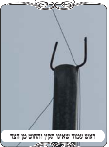
ראש עמוד שאינו תקין והחוט מן הדג

קשורים, וכיצד העמודים עומדים, ועוד הרבה פרטים שכל אחד מהם יכול לפסול את העירוב. ניגשנו קרוב לקטע מסוים, והתחלנו לבדוק מקרוב. ולאחר כמה עמודים גילינו שני עמודים שעשויים בצורה פסולה ממש. ברוב העמודים היה בראש העמוד צורת וי טוב, אבל בשנים האלו