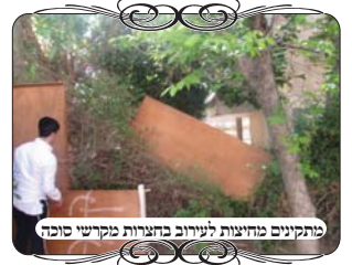
מתקנים מחיצות לעירובין בחצרות מוקדי סוכה

לא באנו לחזק, אלא מצאנו אנשים מחוזקים, אנשים שנהירו תמיד לא מטלטל מחוץ לבית, הגיעו בתקופת הקורונה לזמנים של נסיון, כאשר התפילות מתקיימות מחוץ לבתי הכנסת, בשטחים פתוחים,