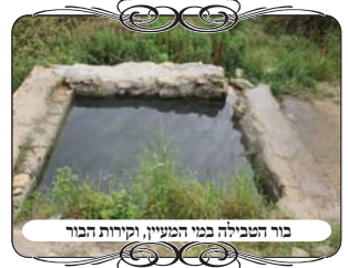
בור הטבילה במעיין, וקירות הבור

אלא שדוקא בגלל הבור יש איסור ללכת עם המים אפילו בתוך ד' אמות, כאשר עולה מן המים אל שפת הבור. משום שהבור של המים הוא רשות היחיד, ושונה מן הנהר שנחשב כרמלית. וההבדל בינו לבין נהר מצוי, מבואר במשנ"ב שגם נהר ששפתו עמוקה י' טפחים [בצורה זקופה או כשיעור תל המתלקט], עדיין יש שני צדדים פתוחים, הצד שדרכו מגיעים המים, והצד שדרכו יוצאים המים, שדרכו יוצאים המים, לכן הנהר נחשב כרמלית. אבל המעייןות הנ"ל שנביעתם קטנה אלא שיש בור עמוק שבו מתאספים המים, הרי הבור מוקף מכל צדדיו, ומה שבתוכו נחשב רשות היחיד.