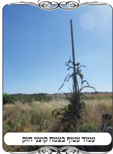
עמוד עשוי בצמח קבוע חזק

באחד העמודים הם הבחינו בשאלה הנוגעת לדין פתחי שימאי. סביב לעמוד גדל צמח קוצני, שניכר שהוא קיים כבר תקופה ארוכה, והצמח עטף את העמוד כולו, ולא רק גדל לידו. לכאורה הרי העמוד במצב כזה, אינו ישר, אלא יש בו בליטות של הצמח שקבוע עליו. והנה בשאלה זו יתכן שיש מי שיאמר שהצמח אינו קשור לעמוד, אלא הם שני דברים, והעמוד מצד עצמו הוא ישר וחלק. [והצמח אינו מחיצה לפסול את העמוד, כי אין בצמח רוחב ד' טפחים להגדיר מקום]. אבל למעשה בעירובים טובים הורו רבני העירובים להקפיד על כך, שגם דבר חיצוני אם הוא נמצא לאורך זמן צמוד לעמוד, הוא מוגדר שינוי צורה קבועה בעמוד, ובעירובים השכונתיים מקפידים לגזום ולפנות סביב לעמודים והלחיים. וכמובן שבעירובים עירוניים ובפרט בישובים, מקילים בזה יחד עם שאר הקולות היותר חמורות שהם נאלצים להקל, ואכן זה מצטרף לרשימת המעלות של העירובים השכונתיים, ולרשימה המלמדת שלא להסתמך על עירובים עירוניים.