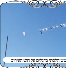
האם יש חשש הלכתי בדגלים על חוט העירוב

באותו ישוב היה מקום אחר שגילינו על החוט של העירוב, שורת דגלים קטנים של יום חגם, תולים על החוט של העירוב עצמו, [ולא כפי שמצוי שתולים חוט אחר קשור לאותם עמודים]. במצב כזה יש חוששים לדין פתחי שימאי בחוט, [כמבואר ברע"א (המובא בשעה"צ שסג, מו) ובחזו"א שדין זה נאמר גם בחוט]. וכמובן זה דבר התלוי בסברה, להחשיב דגלים כדבר המשנה את הצורה. אבל האמת היא שיש בדגלים בעיה אחרת, כיון שהם מנדנדים את החוט ברוחות. החוט מצד עצמו הוא דק וקל ואינו מתנדד לרוח, לכן יכול לעמוד יציב גם באורך של שלושים מטרים או יותר, אבל הדגלים מתנופפים אפילו ברוח קלה, ומחמת המשקל שלהם והגודל, הם מושכים איתם את החוט הרבה. וזה גורע מכשרות העירוב, כפי שהביא המשנ"ב (סו"ס שס"ב) שנחלקו בזה האחרונים, והחזו"א (סי' ע' סק"י) אוסר.