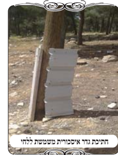
חתיכת גדר איסכורית משמשת ללחי

שאלה נוספת בענין זה, שלח לנו אברך ת"ח שעוסק בעירוב השכונתי של אחת מקהילות המפורסמות בדרום הארץ ומתוך עיסוקו בזה הוא הגיע לעיר אחרת והבחין בעירוב שנעשה עם לחיים, והלחיים היו מחתיכות של איסכורית לבן, המשמש לגדרות של אתרי בניה וכדומה, בגדרות אלו יש בליטות ושקעים, בכל שלושים ס"מ, הפתח מכופף ובולט כחמשה ס"מ, וחוזר ושוקע. בליטות אלו ניכרות מאוד, אלא שבגדרות זה דבר נצרך בשביל היציבות והחוזק של הגדר, וזה מונע ממנה להתקפל, אבל לגבי דיני צורת הפתח נשאלה השאלה הרי זה פתחי שימאי.