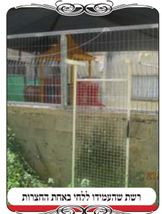
רשת שהעמידו ללחי באחת החצרות

לפ"ז היו דברים רבים שאנשים שאלו בימים אלו האם אפשר להשתמש בהם ללחיים או שמא אינם ראויים לפי מה שנוהגים להקפיד על דיני פתחי שימאי, ובחלק מהמקרים התשובה אינה ברורה. אחת מהדוגמאות היתה בלחי שנעשה מרשת ברזל חזקה, שהעמידו אותה תחת החוט, על מנת שיהיה לחי. אבל בזה הורו הרבנים שאין להשתמש ללחי, מפני שיש בה חורים, ואע"פ שהחורים הם כשיעור חצי טפה, ונחשבים כסתום מדין לבדו, מ"מ לענין לחי צריך דבר שלם כדרך הפתחים. אבל בדומה לזה היתה שאלה דומה מאדם שחיפש לאלתר לחי בחצר, ואחד מהדברים שביקש לעשות, להעמיד לחי מרשת של חרקים, כפי שמצוי בערים מסוימות שעושים בחלונות הבתים, ברשתות האלו יש חורים קטנים מאוד, ובודאי שלחי שיש בו חורים קטנים כ"כ, הם אינם פוסלים אותו. אבל ברשת זו גם החלקים הקיימים הם חוטים דקים מאוד בגודל החורים, ואולי עוד פחות, שהרי הרשת משמשת לחלון למצב פתוח, ועושים את הרשת בצורה שהחוטים יהיו פחות מורגשים, והחורים מורגשים יותר, א"כ נראה יותר שרשת כזו נחשבת לדבר מחורר שהוא נחשב פתחי שימאי.