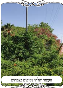
העמוד והלחי עטופים בצמחים

שיש גג בין העמודים למשקוף, ולפ"ז יש לדון מה הדין כשהגג הוא דבר נורמלי שיהיה בתוך הפתח, או שמא הביאור הוא משום הפסק, שהרי מהלכות צורת הפתח צריך שהמשקוף ישב מעל העמודים, וכאשר עושים לחיים דיינו עמודים נמוכים בגובה י' טפחים, ההיתר הוא משום שנחשב שהם עולים עד החוט, והמשקוף יושב על גביהם, ובפרט לפי מה שביאר המשנ"ב (סי' שס"ב ס"ק ס') שהוא מדין גוד אסיק, שרואים כאילו העמודים עולים עד החוט, ולכן כשיש גג באמצע, הרי הוא עוצר את הגוד אסיק,