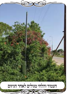
העמוד והלחי מנולים לאתר הגיוון