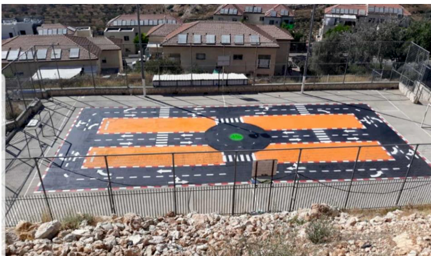
זה נראה לכם חצר תלמוד תורה, או חצר של בית ספר ממלכתי?!...

קעת עולה חשש שמדובר רק בניצינים ראשוניים של החדרת תכנית דומה בתתי"ם נוספים, ובמקביל קיים חשש, שחצר ת"ת תורת חסד בביתר עלית תהפוך למוקד 'עליה לרגל' של תתי"ם וארגוני נוער שונים לצורך ההשתלמות ולימוד ילדי ישראל בכללי