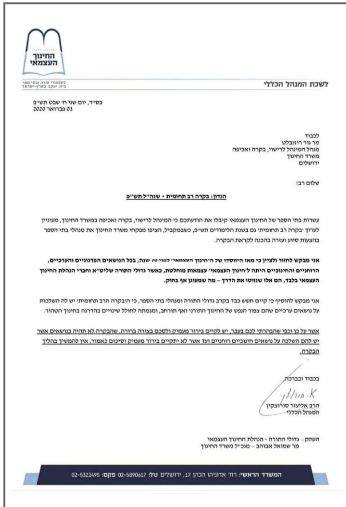
"משרד החינוך מעוניין לערוך בקרה רב תחומית גם בשנת תש"פ" ומה היה בשנת תשע"ט!?"

הדבר מקבל גיבוי מהמסר הברור של מנכ"ל החינוך העצמאי, שככל הנראה אינו מסוגל לעמוד ולהתנגד נמרצות גם בעת שגלוי וניכר לכל שמדובר בתהליך הרסני, ובדומה לפרוייקטים הרסניים אחרים מבית משרד החינוך שהוכנסו למוסדות מהדלת הראשית ע"י 'פשרה' כרצון הפריץ, מזמין הוא גם הפעם את ה'פשרה' הבאה תוך כדי הזעקה המדומה בנושא הבווער, ומסיים