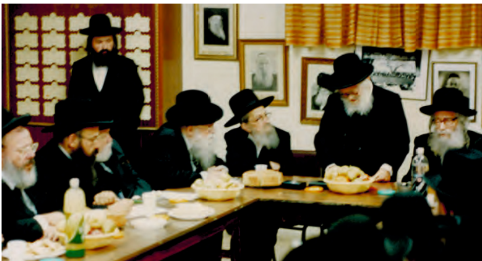
גדולי ישראל צוק"ל באחת האסיפות הקבועות עם הנהלת החינוך העצמאי וכהיום עוזבים מקור מים חיים וחוצבים בורות נשברים