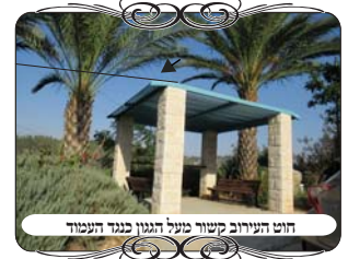
חוט העירוב קשור מעל הגגון כנגד העמוד

באותו ענין יש להביא מקרה אחר שפגשנו ביישוב באזור אחר שבאנו לבדוק את העירוב, והיה שם מקום מסובך מחמת ריבוי העצים, שהענפים גדלים ומגיעים לחוטים ומסיתים אותו ממקומו, [והבעיה היא שאם ע"ז החוט יוצא מכנגד העמודים, ובפרט אם משנה זווית מחמת שהענף דוחף אותו, הרי זה פוסל את צורת הפתח]. לכן אחד מהעוסקים בעירובים שדיבר קודם לכן במקום, מצא להם פתרון שהחוט במקום הזה יהיה נמוך, ולא יגיעו אליו ענפי העצים. בסמוך למקום היתה פינת ישיבה, שמעליה יש גגון שיושב על ארבעה עמודי אבן רחבים, וא"כ הוא קשר את החוט על הגגון בחלק שמעל העמוד, וע"ז יושב צורת הפתח, שהרי יש עמוד רחב מתחת החוט.