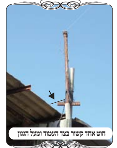
חוט אחד קשור בצד העמוד ובעל הגגון

אחורי אחד מהבתים היה עמוד שנהרס ונחתך, וכיון שלא היה עמוד לקשור אליו את החוט, לקחו צינור ברזל קצר, וחיברו אותו בגובה צמוד לגג של הרפת שהיתה בסמוך, וקשרו את החוט מעל הצינור הזה. במבט ראשון היה נראה שזה צורת הפתח כשרה, ואין בה בעיה. אבל לאחר התבוננות קצרה רואים שהצינור אינו כשר לעמוד של צורת הפתח, כי הוא אינו מגיע עד הקרקע, וכותב השו"ע (סי' שס"ג ס"י, וברמ"א ס"ז) שכל לחי או עמוד צריך להתחיל תוך ג' טפחים לקרקע, ואם הוא מתחיל מעל י' טפחים, הרי הוא פסול משום דין מחיצה תלויה. במקרה זה לא היה ניתן לעשות לחי לפני העמוד, שיהיה במקום עמוד, כיון שהעמוד צמוד לגגון של רפת, ואם ישימו לחי לפניו, הוא יהיה תחת הגגון, והגגון יפסול אותו משום דין גג הבולט בין הלחי לחוט, שכתב המשנ"ב (סי' שס"ג ס"ק קי"ב) שאינו כשר. וראה בגליון הקודם מה שבארנו בדין זה.