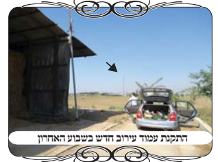
התקנת עמוד עירוב חדש בשבוע האחרון

בפעילות של בדיקת העירובים ותיקון עירובים, לא שקטו במוקד העירוב גם בתקופת הקורונה ובזמן הסגר, הצוות יצא לכל מקום בעזרת אישורי עבודה חיונית, ופעל לקדם ולתקן את העירובים בישוים ברחבי הארץ. אחד מהמקומות שהגענו בשבוע שעבר, היה במושב באזור קרית מלאכי, שיש בו שליח הב"ד המשמש רב במקום, ומתמסר לעשות שיעורים ולרומם את כל ענייני הדת, כמו"כ הוא בודק את העירוב ומתקן את החוטים שנקרעים. בתקופה האחרונה הוא פנה אל הועד של המושב ואמר שצריך לעשות כמה עמודים חדשים, מפני שיש לו מקומות שנהרסו העמודים. אך העניינים התעכבו זמן רב, עד שכעת הגיעה עת רצון, ואישרו את התקציב הנדרש לתיקון העירוב בתיקונים ההכרחיים ביותר. כשהגענו למקום גילינו כמה תיקון היה מוכרח.