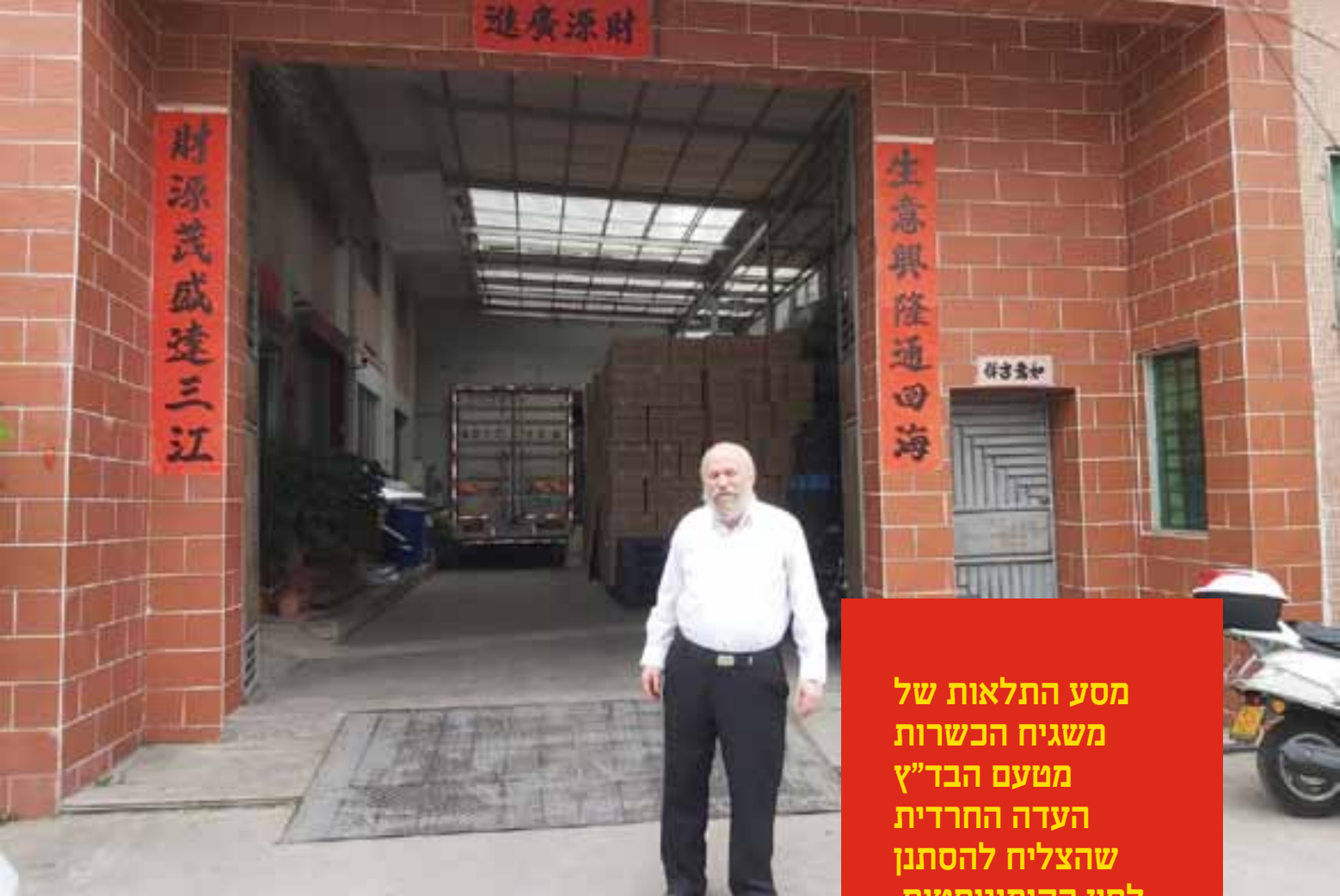
המשגיח בפתח המפעל

מסע התלאות של משגיח הכשרות מטעם הבד"ץ העדה החרדית שהצליח להסתגל לסין הקומוניסטית, הסגורה והמסוגרת, כדי להוביל את מערך הפיקוח הכשרותי במקום ■ מפיקוח של מספר שבועות, המשימה הפכה לפיקוח של מספר חודשים, למען ציבור המהדרין בכל העולם