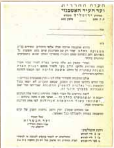
מצוקת חלב הכשר

בגלל חביבות הדברים ומפאת הרלוונטיות שלהם גם לזמננו, נצטט כאן חלק מהמובא במדריך הכשרות של אותה שנה, העוסק בתחום