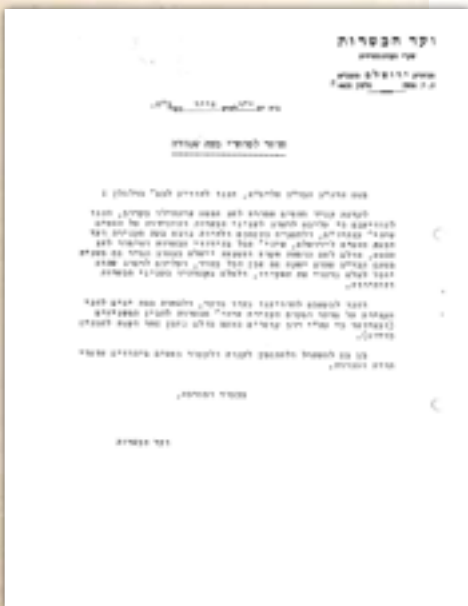
חוזר לסחרי מצה שמורה

מגידולי הארץ, ואין מרשים הבאתם מחו"ל". פתרון לכל הבעיות עוברת ראשית כל דרך התאחדות והתלכדות הציבור ככוח אחד גדול המסוגל לדאוג לפתרונות ביעילות רצויה. ולכן הקריאה מופנית אל הציבור הרחב: