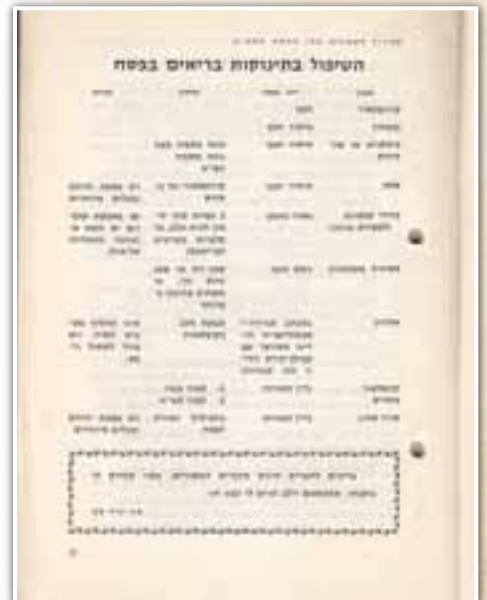
רשימת מזון לתינוקות לפסח