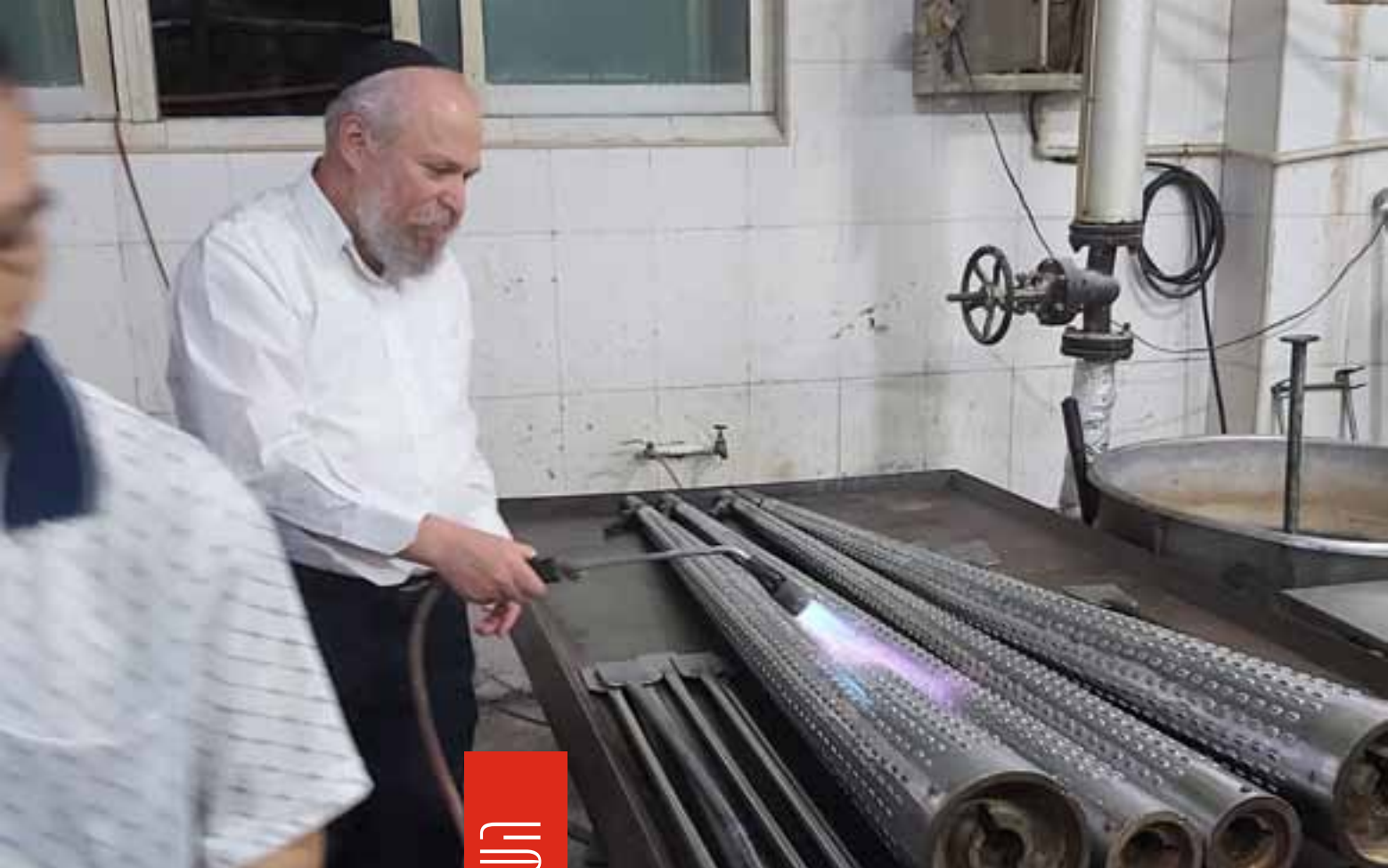
המשגיח בהכשרה והגעלה