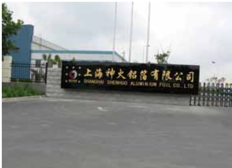
שערי המפעל בסין

גם בקולומביה הרחוקה, התרחש סיפור דומה... מפעל גדול שמיצר קפסולות וכמוסות במדינה הדרום-אמריקאית, ביקשה לקיים פס ייצור שכזה בהשגחת