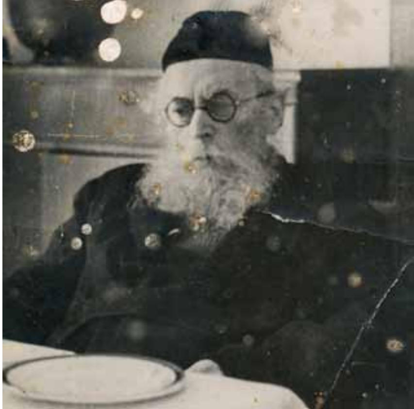
מרן החזון איש ז"ל