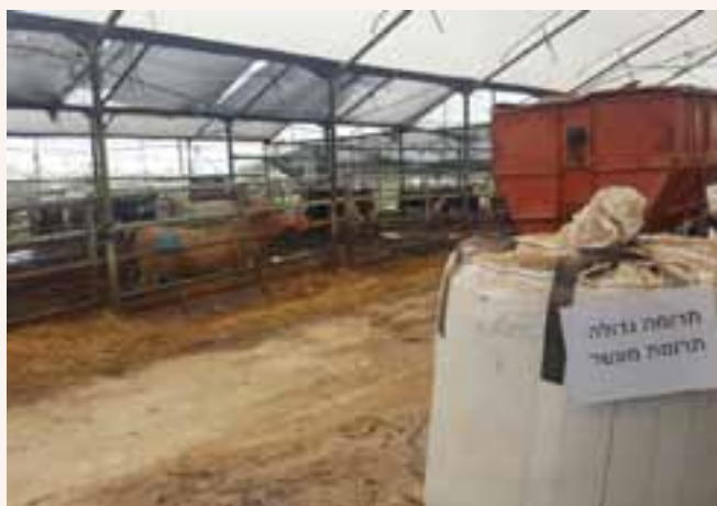
תרו"מ בביג בג'ס

בינות למלגות השועטות במתחם, מתרוצצים המשגיחים ומפקחים כי שום קרטון פרי או ירק לא יזלוג החוצה ממתחם הבד"ץ ועל אחת כמה וכמה ששום קרטון מפוקפק לא יזחול פנימה. ובשעה שהזמנה כלשהי מגיעה למערכת לתוצרת בד"ץ, נהגי המלגזות המיומנים מתחילים לשעוט בין המסדרונים, מסדרים אותם על משטח, תחת פיקוח מלא של המשגיח התורן ורק לאחר אישורו בלי חשש ערלה והופרש תרו"מ, המשטח עובר לאריזה, גם הוא עם כיסוי מיוחד: כיפה בד"ץ, מעין יריעה ניילון עם אישורי בד"ץ, המכסה את כל משטח הזמנה מלמעלה ומכריז בגאון על כשרותו.