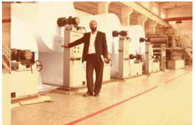
ייצור נייר כשל"פ