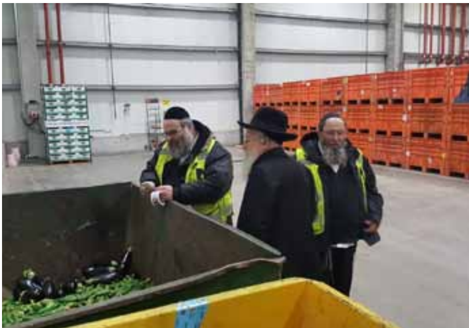
המשגיח מפריש תרומ