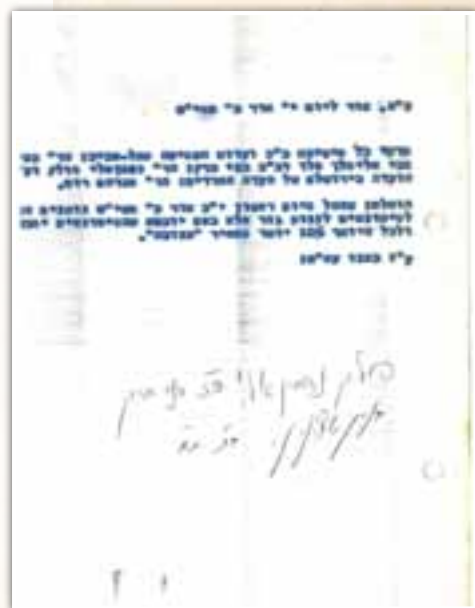
פרטי כל שמיטה