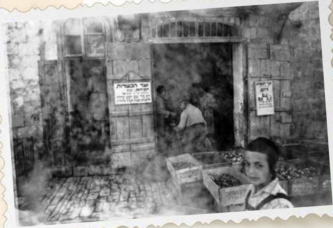
חנוות ירקות בשוק מאה שערים בימים ההם