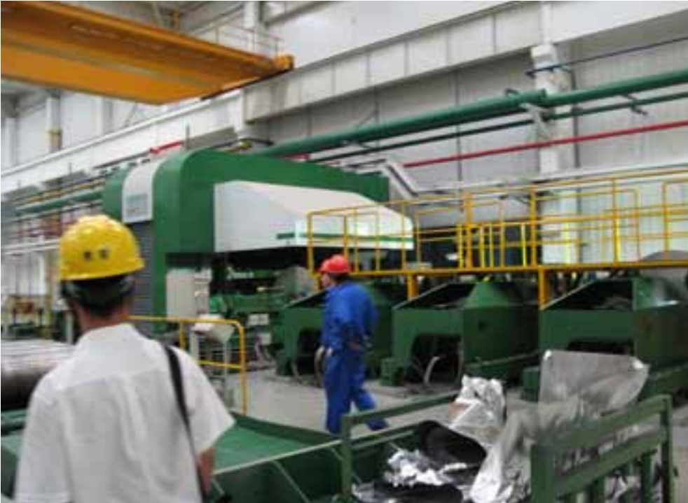
ייצור רדידי אלומיניום