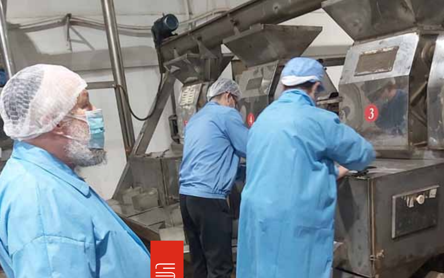
השגחה צמודה לכל אורך תהליך הייצור