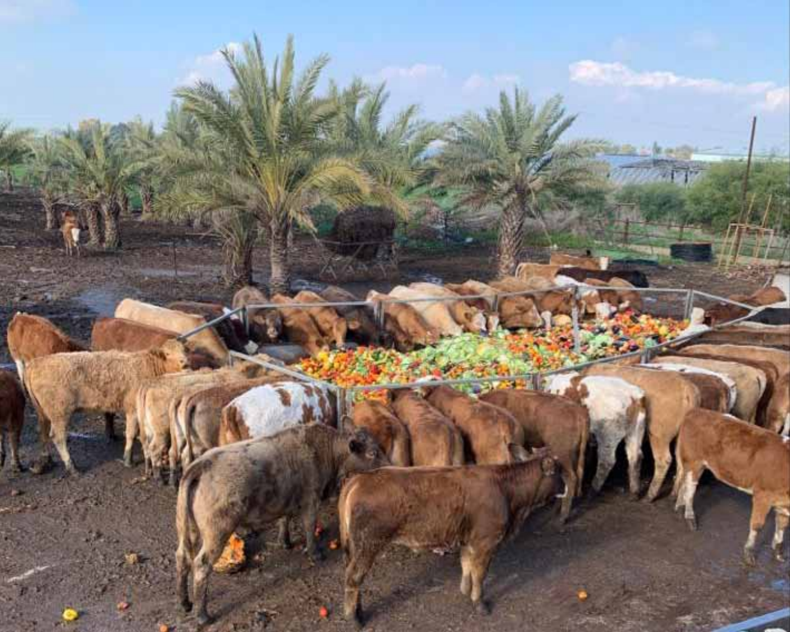
תפריט עשיר לעדר הפרות של כהן

ברקע אנו נתקלים שוב במחזה המשעשע משהו, המזכיר 'גן עדן לפרות', פרות הרועות בשלווה ברפת הפתוחה ואוכלות לשבעה עגבניות, תפוזים וחצילים, תפריט עשיר של סעודת מלכים... בהשגחת הבד"ץ של העדה החרדית! וכך, כשהן אוכלות לשבעה, אנו זוכים בקיום השמדת התרו"מ למהדרין מן המהדרין.