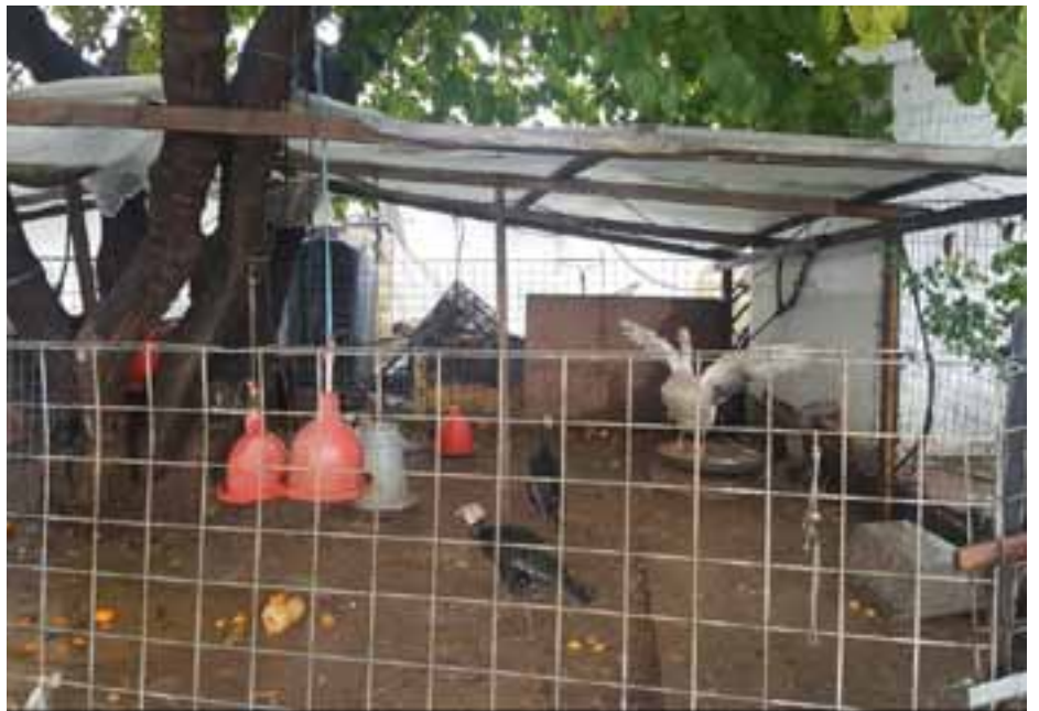
גם העופות של הכהן זוכים לפירות תרומת מעשר