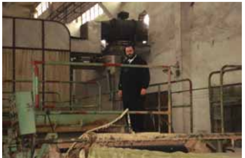
המשגיח בפיקוח בייצור מוצרי נייר כשר לפסח