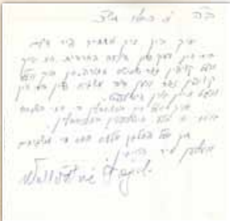
התחיבות לדרישת הבד"ץ תש"כ