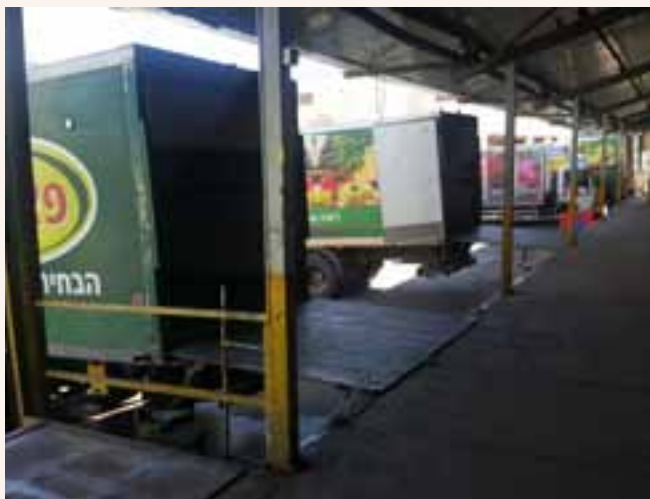
מלאים הערכה למשפחת רחימי-פאר לי המעניקה גב להידורי הכשרות

גבי הרמפה. המשאיות הפורקות את התוצרת החקלאית על הרמפה, פוגשות תיכף ומייד את המשגיח מטעם הבד"ץ, אשר מבצע את הפרשת התרו"מ, לפי כללי הבד"ץ המחמירים. עמדתו של משגיח הבד"ץ, הוא מייד בשערי המתחם, בסמוך לרמפת הפריקה. כך הוא הראשון שפוגש את התוצרת ובלעדיו היא לא תוכל להקלט פנימה.