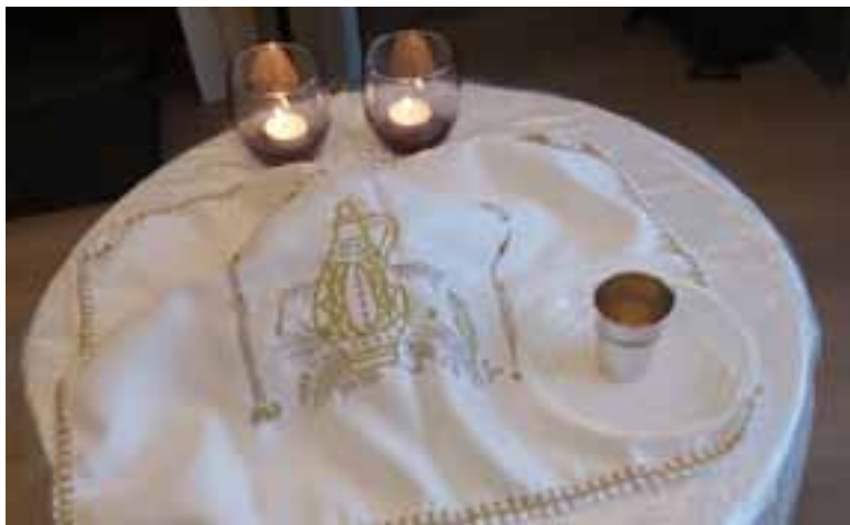
שולחן השבת של המשגיח

גם המשימה הכשרותית מקבלת מימד אחר במהלך 336 שעות הבידוד, וכפי שלימדנו אבי תורת המוסר רבינו רבי ישראל סלנטר עם המשל על אותו עשיר שהגיע לבית מלון יקר ביותר, אשר הרשה לעצמו לבלות שם רק יום אחד מפני מחירו הגבוה. להפתעתו הוא מוצא שם את אחד מחבריו הפשוטים, מבלה שם זמן רב. הוא שואל אותו כמה זמן הוא עושה שם? וזה עונה לו,