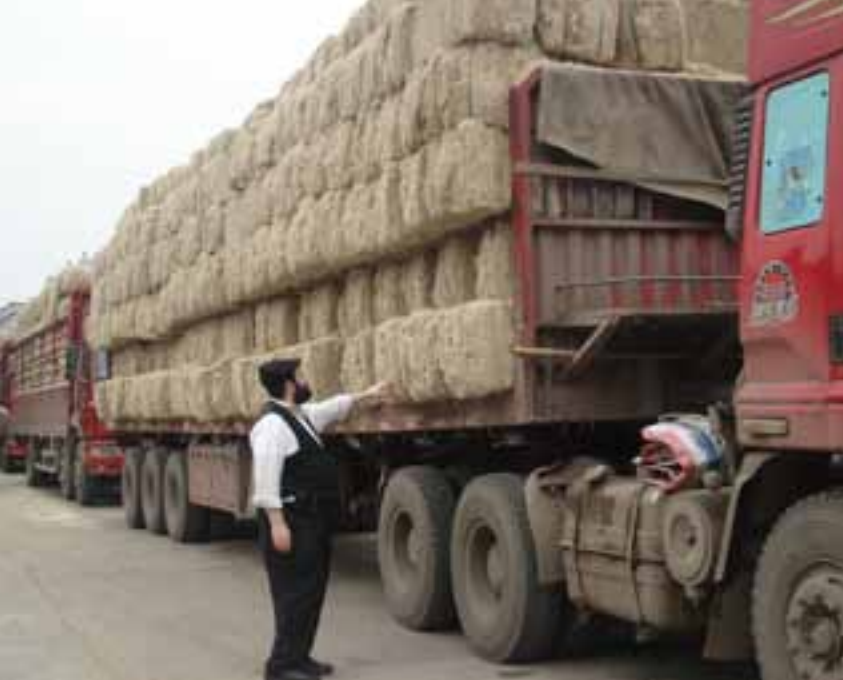
המשגיח בודק "צלולה" עבור ייצור מוצרי חד פעמי מנייר כשר לפסח