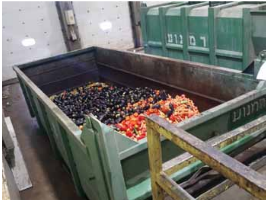
מכולת התרו"מ של הבד"ץ