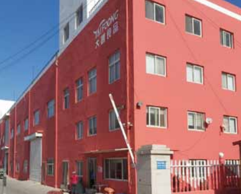
מפעל היצור הפפריקה בסין

"מסתבר כי הייתי היחיד שעלה על מטוס לצרפת ומשם אמור הייתי להמשיך לסין, היחיד שפניו מועדות למדינה הקומוניסטית. כך מצאתי את עצמי בשעה שכולם מתרחקים מהמדינה המצורעת, דווקא אני הייתי היחיד שבדרך לשם. אף אחד לא היה שם כדי לעזור או לתרום מנסיונו.