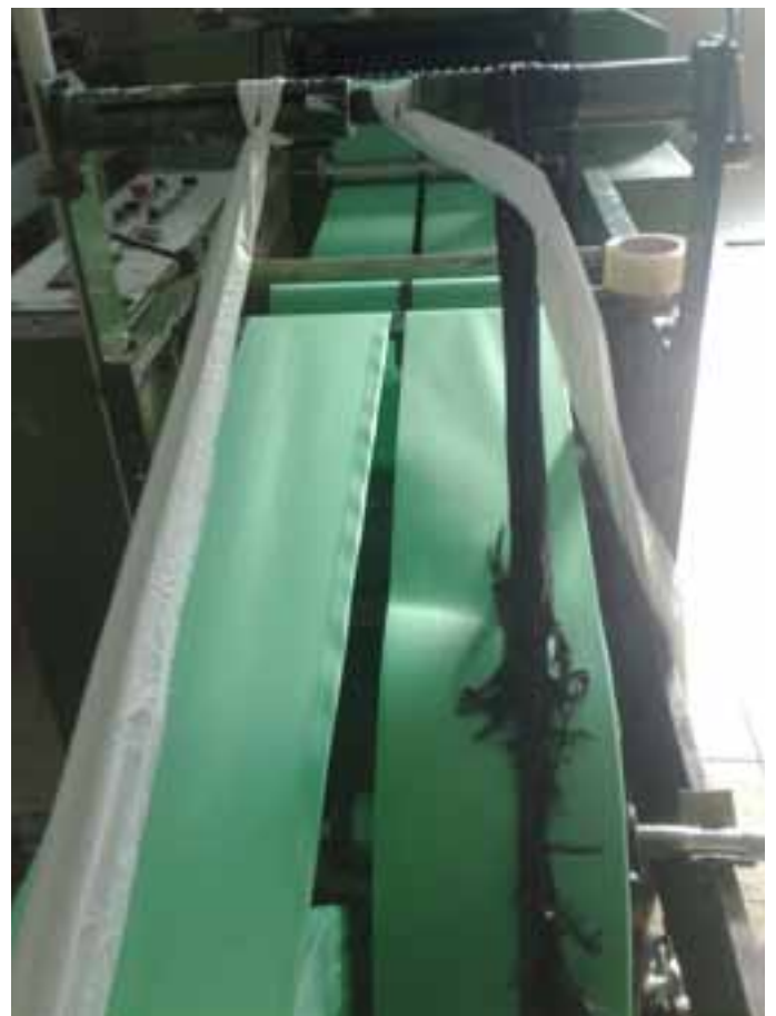
ייצור מוצרי ניילון כשר לפסח