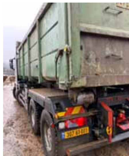
המשאית חתומה בפלומבות הבד"ץ