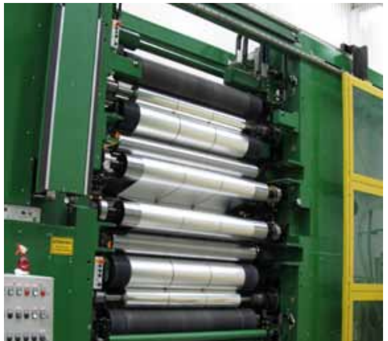
תהליך ייצור רדידי אלומיניום

וניקח לדוגמא את חומר הפלסטיק, ובעיקר סוגי הניילון הנצמד. בשוק קיימים שני סוגים העונים על