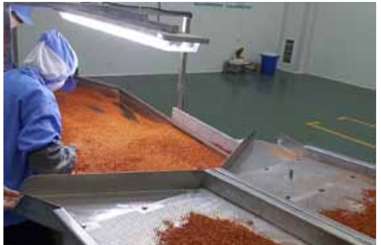
הפריקה לאחר שנטחן עובר בדיקה