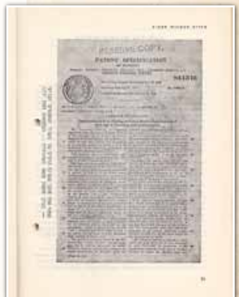
כשרות חמאת קקאו