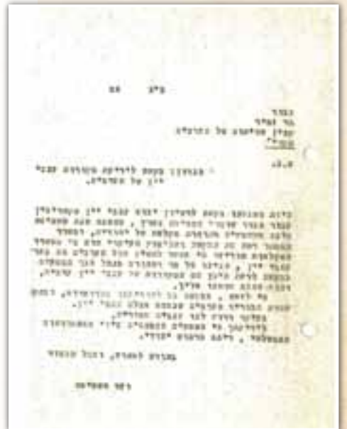
ענבי יין נקיים משיבית