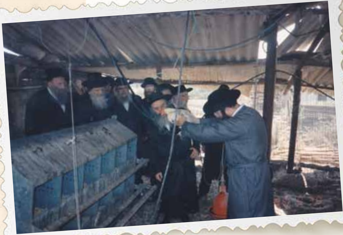
מרן ורבנן הרבנים הגאונים חברי הבד"צ הגר"מ האלברשטאם והגר"מ ברנדסדורפר והגר"י בלויא זצוק"ל ויבלחט"א הגאון הראב"ד שליט"א בבדיקת כשרות עופות בלול תרנגולים

ועד השמיטה החנות הזאת של בהשגחת רבנות העדה החרדית בעניני שמיטה