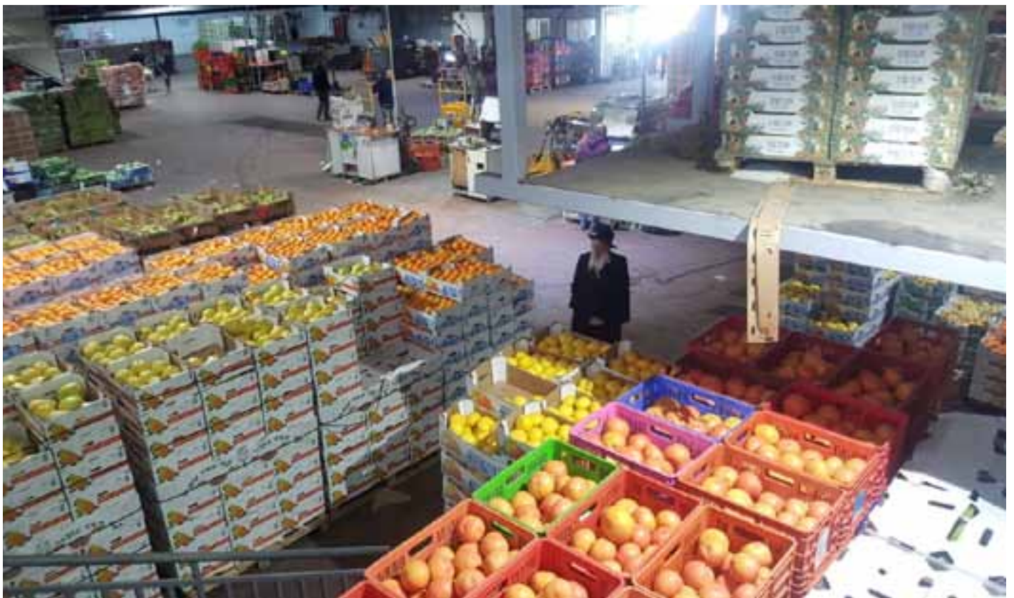
הגרא"ד ליטמנביץ שליט"א בסיוור בשוק הסיטונאי