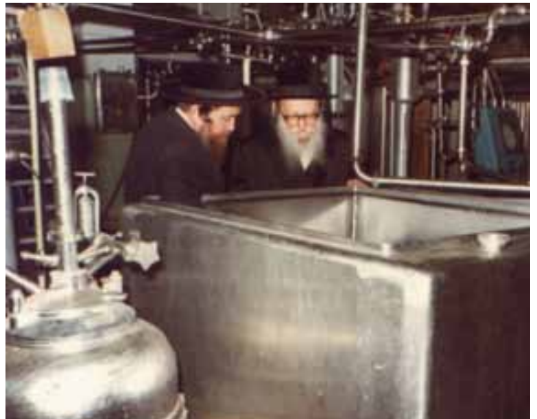
מרן הגאון הגדול בעל המנחת יצחק זי"ע עם הרה"ג רבי אברהם אהרן שיינברגר זצ"ל מראשי ועד הכשרות במפעל לייצור חלב "תנובה"

"אבל עדיין לא נגענו בבעיית אספקת הגידולים האלה למגדלים. כידוע ט"ו באב, הינו המועד האחרון בו אפשר למנות לעץ את השנה הראשונה, במידה והוא אכן מחובר לקרקע. מכיוון שכך, המגדלים מתכננים את השינויים במטעים בהתאם לתאריך הזה, כך שרוב ככל העבודות מתרכזות בתקופה זו, כדי להספיק את התאריך הזה. אם המשתלות היו מספקות את השתילים במועד ומאפשרים לבעלים לשתול אותם טרם ט"ו באב, עוד לפחות הרווחנו שנה אחת מט"ו באב עד ראש השנה. אבל גם זה לא קורה. במשתלות הם מבטיחים למגדלים, כי אין בעצם הבדל