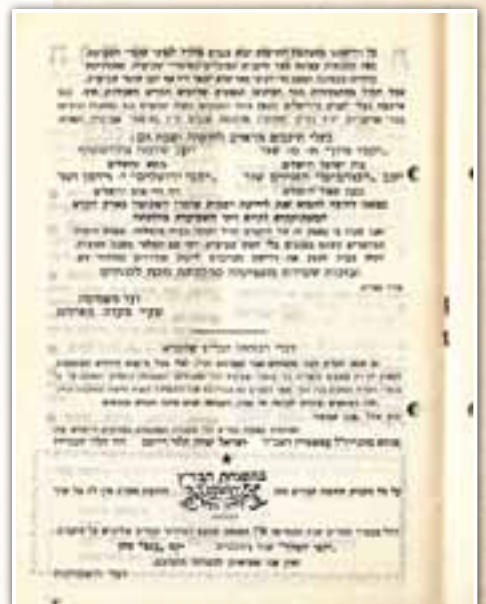
רשימת יקבים שומרי שמיטה