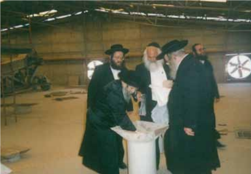
הגאון הגדול רבי יעקב בלויא זצ"ל ויבלחט"א כ"ק אדמו"ר מטשאקוה והגרח"ן כהן והמשגיח הרב פנחס פרידמן בהפרשת תרו"מ