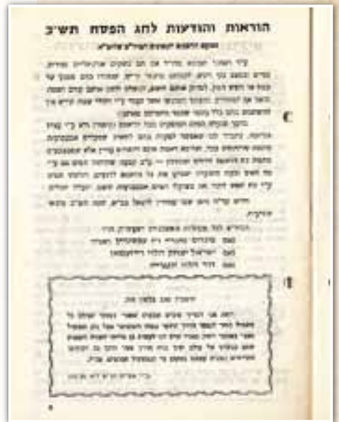
הודעות לחג הפסח תשי"ב

"התוצאה היתה: סיומו המוצלח של מאבק ממושך שניהל ועד הכשרות על טהרת מצרך זה. לא חסכנו כל עמל ולא יקר בעניינו כל מאמץ