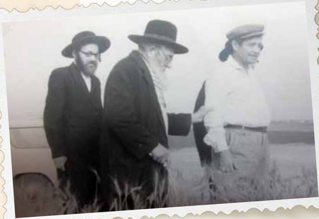
מרן הגאון האדיר רבי פנחס עפשטיין זצוק"ל בביקור שדות חטים למצה שמורה ב"חפץ חיים"