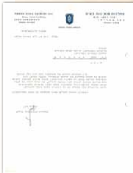
מכתב מחברת טנא נוגה

מעניין למצוא גם מכתב מסוג נוסף של אנשים הממענים את בקשותיהם אל ה"בד"ץ, כמו במסמך המעניין הבא מאת הד"ר אהרן וינר, מתאריך כ"ו אלול תשכ"ה, ובו כותב ש"אכיר לכם רוב תודה אם תואילו בטובכם כעת לשלוח לי מייד את המדריך שלכם לשנת השמיטה הבעל"ט".