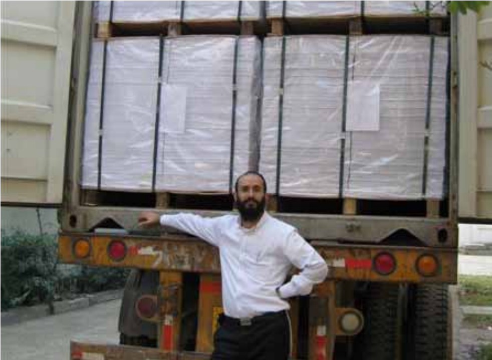
המשגיח סוגר את המשאית עם פלומבה