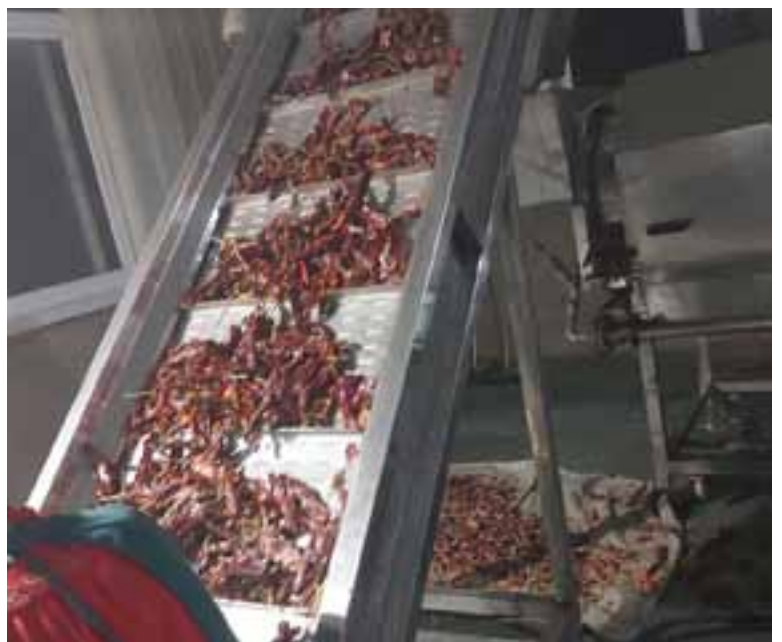
ייצור פפריקה כשר לפסח

התחשבות. גם לכך המשגיח היה מוכן. אבל אז נוצרה הבעיה, באיזה מלון אתה אמור לשהות? מי אנשי הקשר שלך בסין? ועד שכל הפרטים הקטנים והאחרונים נרשמים