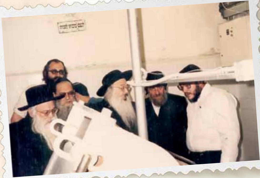
מרן הרבנים הגאונים מהרי"מ דושינסקיא והגרא"ד הורביץ שליט"א והרה"ג רבי אברהם אהרן שיינברגר זצ"ל בביקוח במאפיות המצות