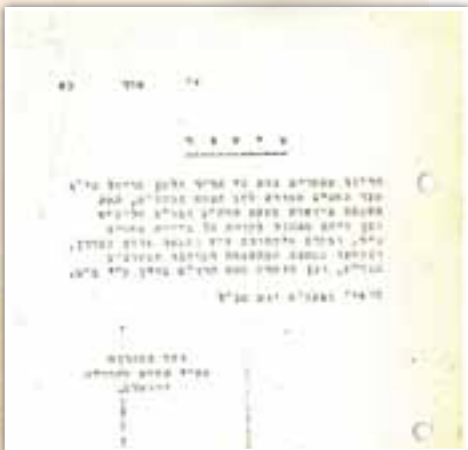
אישור קצית חיטים שמורה