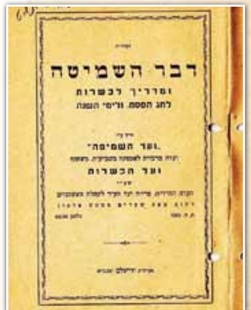
דבר השמיטה תשי"ט