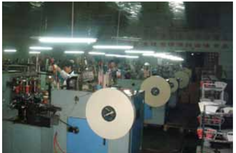
ייצור כוסות נייר בהשגחה

בנוסף לכך, 80% מייצור של הניילון, הוא סמי אוטומטי, כלומר, יש בה מעורבות יד אדם, כאשר המשמעות הפשוטה היא