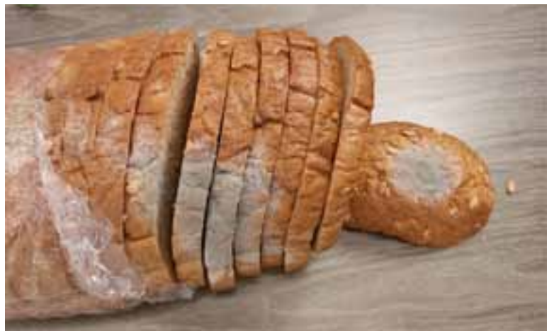
לקראת סוף הבידוד לחם התעפש

בתחילת חודש תשרי, בין כסה לעשור, פיקח המשיגה על הליכי עיבוד דגי טונה במשך מספר ימים, אלא שאל המפעל הוא נדרש לטוס מספר שעות הלוך וחזור.