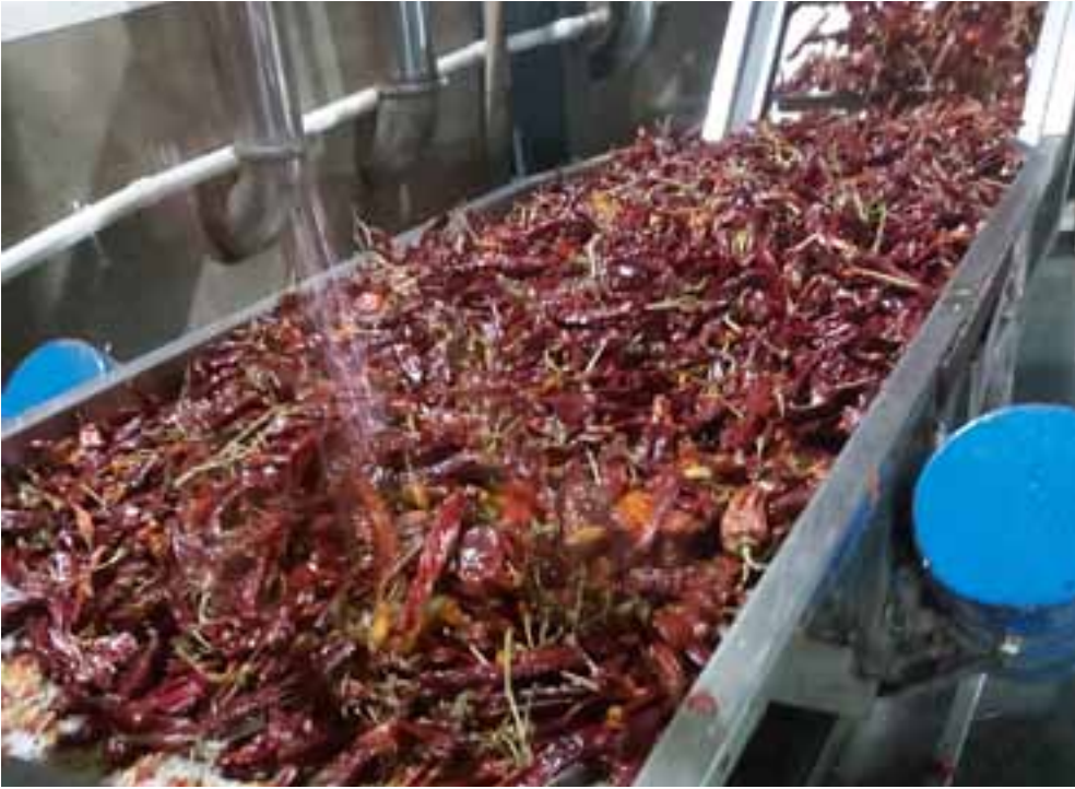
הפפריקה עובר ניקוי

הסיני בשנגחאי, אלא שהפעם, במקום שיקבלו את פניו פקידים ושוטרי גבול, הוא פגש...אסטרונאוטים.