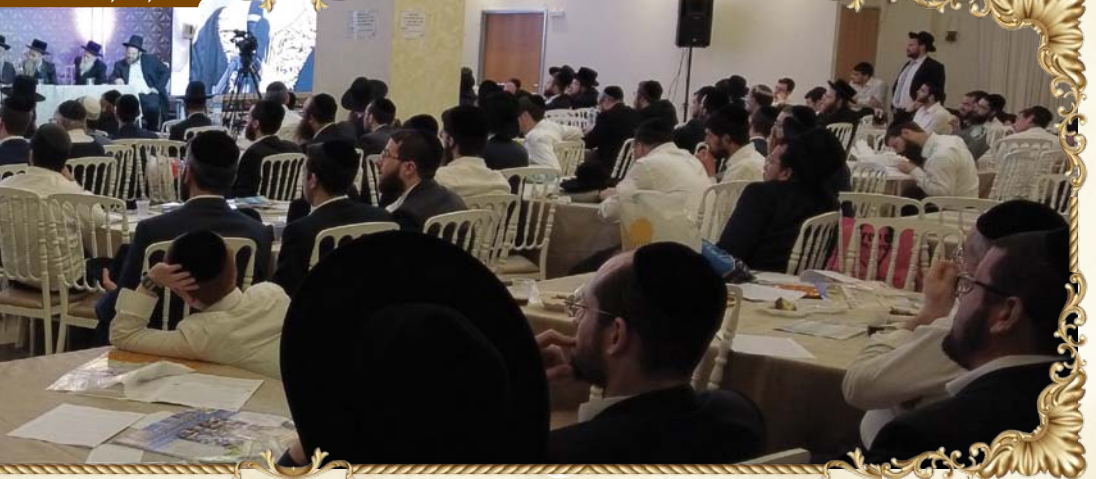
הצק מוקהס בנאמו שש