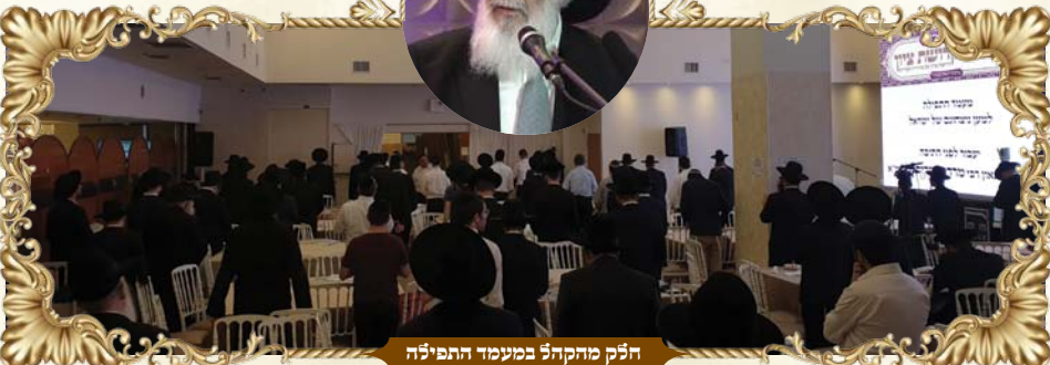
הפק מהקהל במעמד התפילה