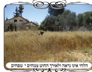
הלחי אינו נראה ולאורך החוט צמחים י' טפחים

בשבוע זה נסענו במסגרת תפקידנו לשני ישובים, לבדוק את מצב כשרות העירוב, לספק ציוד לקשירת חוטי עירוב טובים, ובאחד מהם גם לדאוג לתיקון באופן שבני תורה יוכלו לסמוך עליו. אחד מהדברים הנוגעים בתקופה זו לעירובים הטובים, הם הצמחים הרבים שגדלים בארצנו, שבמקרים רבים הם גורמים חשש כשרותי לעירוב, וצריך לגלות עירונות להסיר אותם בזמן הנכון, לפני שמגיעים לחשש הלכתי. הדבר שנתקלנו בו בכמה מקומות הם בצמחים שגדלים לאורך חוטי צורת הפתח, ומגיעים לגובה י' טפחים, וא"כ הם מחיצה המחלקת תחת צורת הפתח. יש תקופות שהצמח ירוק וצעיר, והוא מתנדנד ברוח מצויה, ואז אין לו דין מחיצה [למשנ"ב, ולפעמים גם לחזו"א]. אבל אחרי שהצמח נהיה עבה, או צפוף, ובפרט אחרי שמתבשר ונעשה צהוב, אינו מתנדנד ברוח, והרי הוא מחיצה לפסול.