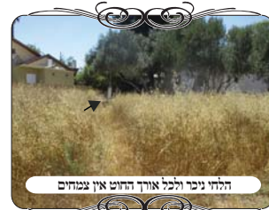
הלחי ניכר וכל אורך החוט אינו צמחים

הפתרון הוא, לכסח את הקוצים, לגזום את הצמחים, לפחות שלא יהיה בהם גובה י' טפחים, [ונוהגים להחמיר גם בשיעור רח"ו]. וכן מומלץ להוריד יותר, כדי שהבעיה לא תחזור שוב תוך זמן קצר. רוב עובדי העירוב כידוע אינם מצוידים בכלי גינון משוכללים, והם בוחרים לעשות את המצוות בגופם, וכאן הם פוסעים בתוך הקוצים, דורכים על הצמחים היבשים, קצת נדקרים ומתלכלכים, עד שרואים את כל אורך צורת הפתח פנויה מחשש מחיצה.