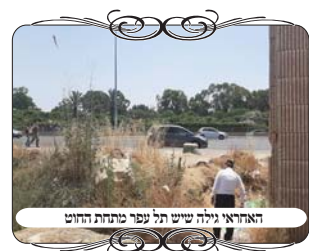
האחראי גילה תל עפר מתחת החוט

שאל האברך האם אפשר לומר שערימה זו היא דבר ארעי שאינו