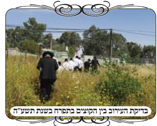
בדיקת העירוב בין הקוצים בתפרח בשנת תשע"ה

סיור הבדיקה ההוא לא נשכח מזכרונינו, היה זה בתקופת הקיץ בשהת תשע"ה, וכדי לבדוק את העירוב עברנו בתוך שטחי קוצים רבים, ושמ היה סוג מיוחד של קוצים דקים, שנכנסים לבגדים ודוקרים, וקשה מאוד להוציאם יותר מכל מקום אחר. בשלב מסוים כבר לא היה שייך להמשיך ללכת בצורה כזו, כולם נעצרו והתישבו על הקרקע להוציא קצת מהקוצים, עד שהביאו לנו ג'יפ משטרת, שלקח את כל המשתתפים להמשך הבדיקה.