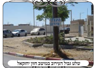
שלט גבול העירוב בנושב חזון יתקאל

אלא שכאן מגיעה הבעיה לאדם הפרטי, איך לדעת את הגבולות של העירוב המהודר, לפעמים הבית השני ברחוב בתוך העירוב, והשלישי כבר לא. מי קובע איפה העירוב יסתיים, ומדוע באמת לא להכניס את כולם, לפעמים דוקא את הבנין שלי השאירו מחוץ לעירוב, מדוע לא התקדמו עוד בנין אחד. האמת היא שלא נוכל להסביר כאן את הכל, יש הרבה שיקולים שצריכים לשקול בבניית עירוב, גם הלכתיים וגם טכניים וגם מצד הסכמת שכנים, וזה עניין של מקצוע כמו כל דבר. אבל באמת אם אתה מאוד רוצה, תוכל לפנות לאחראי ולשלם לו על הרחבת העירוב, וכן תוכל גם לשתף עוד שכנים שמבינים את התועלת הגדולה בכך, ואז גם אתה תהיה בפנים.