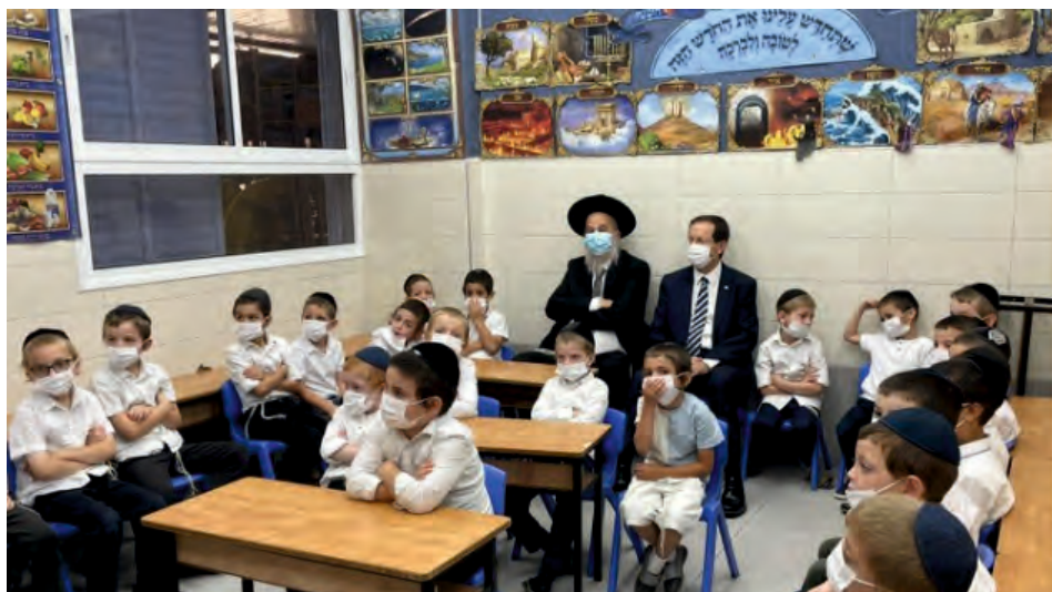
נשיא המדינה בביקורו בתלמוד תורה קרלין בבני ברק

בגמ' (בבא בתרא כא.) מבואר, שלפני תקנת יהושע בן גמלא, מי שהיה לו אב היה הוא מלמדו תורה, ומי שלא היה לו אב לא היה אותו ילד לומד תורה. מה עשו, התקינו שיהיו מושיבין מלמדי תינוקות בירושלים, ומדוע בחרו בירושלים, מפני שהפסוק אומר "כי מציון תצא תורה", ומבאר שם התוס' שהסיבה שהושיבו מלמדים דווקא בירושלים: "לפי שהיה רואה קדושה גדולה וכהנים עוסקים בעבודה, היה מכוון לבו יותר ליראת שמים