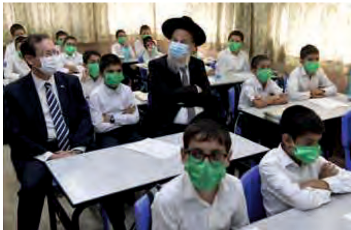
הנשיא (וראש העיר לידו) מתיישב בין הילדים הלבושים בגדי שבת באווירת חברות וידידות

לאחר מכן השתתף הנשיא בשיעור הראשון של תלמידי כיתה א' ובירך אותם לרגל פתיחת שנת הלימודים, כשעיניהם תלויות בו ואוזניהם קשובות למוצא פיו, רחמנא ליצלן.