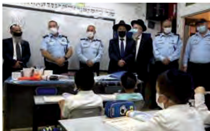
המפכ"ל ובכירי המשטרה מתקבלים בתלמוד תורה