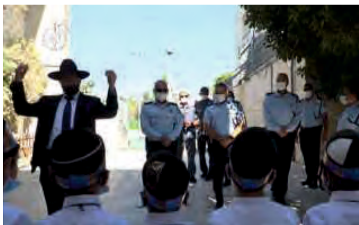
אחד מאנשי הצוות מנצח בהתלהבות על קבלת הפנים

"אני מתרגש מאוד מהביקור ומקבלת הפנים החמה. משטרת ישראל שמה לה את הקשר עם הקהילות החרדיות בסדר עדיפות