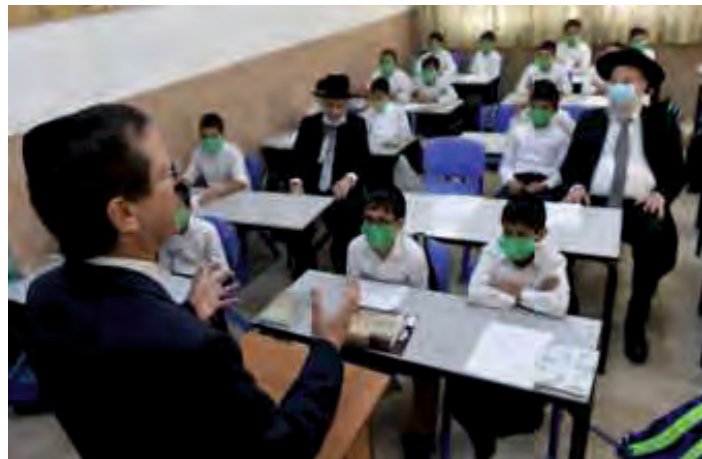
המלמד, ראש העיר והילדים מקשיבים בדרך ארץ וכבוד לדברי הכפירה של הנשיא: "תזכו להאדיר תורה ומצוות ולאהוב את מדינת ישראל וצבא ההגנה לישראל"