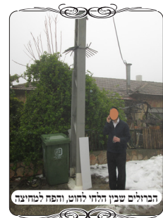
הברזלים שבין הלחי לחוט, והפסק למחיצה

אבל האברכים שעסקו בשטח הסתפקו האם הברזלים שעל העמוד לא יפסיקו ויבדילו בין הלחי לחוט, והרי מבואר במשנ"ב (סי' שס"ג ס"ק ק"ב) שאם יש דבר המפסיק בין הלחי לחוט הוא פוסל. אלא שהמשנ"ב דיבר על גג המפסיק, משא"כ כאן אין גג ממש, אלא דבר קטן ודק, ומסתבר שאינו עושה הפסק כלל אמנם בשיעורים הבאנו שמרן הגר"ש אלישיב זצ"ל הורה לאסור גם במקרה שאירע שהיה כבל חשמל שחור [שעביו כארבעה ס"מ] שעמד בדיוק בין הלחי לחוט, כיון שהוא מפסיק את חיבור הלחי לחוט. ומרן הגר"ש קרליץ זצ"ל אמר שרק בשיעור טפח ומעלה חשוב להפסיק, ולא כל דבר קטן. ולפ"ז לדעת הגר"ש זצ"ל דאי שאין בעיה אם הברזלים שבצידי עמוד החשמל יהיו בנקודה שבין הלחי לחוט. אבל גם לדעת הגר"ש"א בדרך כלל לא יהיה בדיוק בנקודה