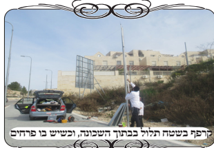
קרפף בשטח תלול בבית שמש, וכשיש בו פרחים

בהקמת העירוב התעוררה שאלה הלכתית בשני מקומות, שיש מורד תלול שנוצר מחמת ההפרש של הגובה בין הרחובות, כפי שמצוי בעיר שבנויה על הר, שבין הרחוב התחתון לרחוב העליון יש קטע של כעשרה מטרים שהקרע משופעת מאוד ולא משתמשים בה. בעיר בית שמש מנצלים חלק מהקטעים האלו, לעשות פרחים וצמחים לנוי לאורך השכונה. וכאן השאלה האם שטח זה נחשב קרפף, כיון שאף אדם לא יעבור בו, או שמא זה חלק מתשמישי העיר שיש חלקים שמשמשים לנוי. אמנם כאן מטרת הנוי מגיעה רק אחרי שהשטח אינו ראוי לשימוש, אבל בכל זאת בסופו של דבר זה משמש לנוי. שאלה זו היתה גם בתוך שכונת רמת בית שמש ג' ברחוב יחזקאל, והכריעו הרבנים שיש להוציא את השטח מהעירוב. ויש להאריך במקורות לדין זה, ואכמ"ל. במקום הנ"ל ברמה ג', יש בעיה טכנית להבדיל את