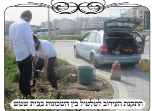
התקנת העירוב לטלטור בין השכונות בבית שמש

כמו כן עשינו חשבון, שגם לענין תחום שבת יש בזה נפק"מ גדולה, כיון שאין רצף בין השכונות, ואז יוצא שמי שהולך משכונה לשכונה, מותר ללכת רק עד המקום שמסתיים האלפיים אמה, אפילו שזה מסתיים באמצע השכונה, כמ"ש בשו"ע (סי' שצ"ט ס"ז) בעיר שיש באמצע הפסק בלי בתי מגורים בשטח של רק קמ"א אמה ושליש [שהם בסה"כ 68/81 מטר]. וכבר כל חלק צריך למנות אלפיים לבדו מסוף הגוש שלו. הדברים התפרסמו בשכונה, וגרמו להתעוררות גדולה.