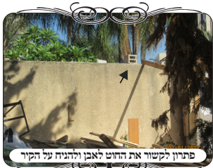
פתרון לקשור את החוט לאבן ולהניח על הקיר

במקביל לעבודות בהקמת עירובים ובשיפוץ בהשקעה טובה וחזקה, אשר דורשת משאבים של תקציבים, ומשאבים של עובדים נבחרים שיועדים את השילוב בין עבודה מקצועית לכשרות הלכתית. יש גם מקרים שבהם צריכים להשתמש בפתרונות זמניים מאולתרים, וגם בהם צריך בקיאות רבה לעשות אותם כדון. נביא כאן מעט מהדברים, כדי להוסיף לקוראים היקרים עוד ידיעות חשובות, המשלבות ידע הלכתי עם ידע טכני.