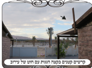
קרשים קטנים בקצה הגגות עם חוט של עירוב

אך לצערנו יש מקומות שעושים עירובים ע"י אנשים שאמנם למדו הלכות אבל אינם בקיאים בפרקטיקה של ההלכות, וסומכים על ידיעותיהם בלי לעסוק בלימוד מומחים, לכן יש הלכות ידועות שאינן כתובות בבירור או שאינם מתורגמות למציאות של ימינו, ואינן ידועות דרך הלימוד לבד, ויוצא שעושים עירובים פסולים ונותנים לציבור לסמוך עליהם ולהיכשל ח"ו בחילול שבת. לעומת זאת יש לציין שבשנים האחרונות רבים לומדים את ההלכות העירובין למעשה במסגרת מסודרת ורוכשים ידע נפלא ונכון, ויודעים לעשות כראוי, ושואלים על כל דבר המסופק, וזוכים להציל את הציבור מחילול שבת, ולזכות את הרבים, וזכותם היא לאין שיעור.