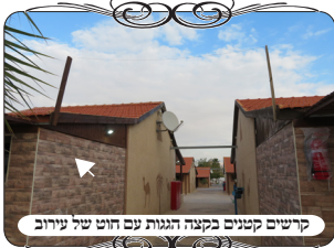
קרשים קטנים בקצה הגגות עם חוט של עירוב

דבר נוסף מעניין ואולי גם מצער, סיפר לנו שהוא פגש בבדיקת מתחם של אירוח באזור ים המלח, עבור קבוצה חרדית שנסעה לשבת, וביקשו ממנו לדאוג להם לעירוב כשר. הוא הגיע למקום וגילה שמישהו עשה שם עירוב בצורה משונה מאוד. בכמה מקומות בשפת הגג של הבנינים הצמידו קרשים שאורכם י' טפחים [כנראה לפי שיעור רח"נ], וקשרו חוט מעליהם. אמנם במבט פשוט רואים שהעמודים האלו עקומים באופן ניכר, וגם החוט שעליהם שוקע באופן ניכר, אבל הדבר הקריטי יותר שאדם שיוודע את ההלכות רואה מיד, שאין לעמודים האלו דין צורת הפתח כלל אפילו לא בשעת הדחק, מפני שהם תלויים בגובה שני מטרים מהקרקע, ועמוד תלוי באויר, שיש תחתיו חלל ג' טפחים או יותר, אינו כשר כלל. דין זה מבואר בשו"ע (סי' שס"ג ס"י) לגבי לחי של מבויה שאם הגבירה מן הארץ ג' טפחים פסול, וכתב המשנ"ב שאף אם יש בעמוד י' טפחים פסול, כמו כל מחיצה שתלויה ג' טפחים פסולה, וכן הדין בעמוד של צורת הפתח כמבואר בתרומת הדשן (סי' ע"ד) המובא ברמ"א שם (ס"ז). וזה דבר פשוט לכל מי שעוסק בעירובין.