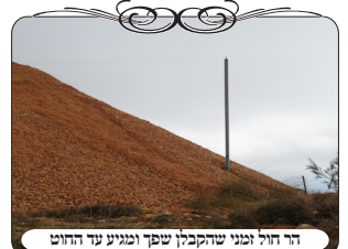
הר חול זמני שהקבלן שפך ומגיע עד החוט

מתוך ההיכרות והמענה שיש למוקד העירוב עם מאות עירובים ברחבי הארץ, יש הרבה אחראים שמעדכנים אותנו בהתקדמות שלהם בשידורג העירוב ובהרחבתו, ומתעצמים בשאלות העומדות על הפרק. השבוע מסר לנו הרב האחראי על העירוב ביישוב החרדי תל ציון, דבר נדיר שאירע לו בעירוב, שאחת מצורות הפתח נפסלה מלשמש לעירוב למרות שהעמוד לא נפל והחוט לא נקרע, ולא היה שייך לתקן אותה, אלא זה דרש ממנו לשנות את הגבול של העירוב. בתקופה האחרונה בונים ביישוב עוד בתים רבים, וכידוע אצל העוסקים בעירובים שכל אזור שיש בניה התקלות רבות, ודורשות הרבה השקעה לתקן את העירוב. במקרה זה היתה צורת הפתח מסודרת עם עמודים ולחיים בגובה טוב, והוא גם דואג להודיע לקבלנים שלא יהרסו את העירוב, אבל פתאום הוא מגלה שהקבלן שעובד בסלילת כביש חדש, הביא כמות עצומה של חצץ ומילוי, ועשה ערימת חול גבוהה מאוד, בגובה כששה מטרים או יותר, וקבר את הלחי וחצי מהעמוד בתוך החול, והחוט נשאר קיים ולא נקרע, ועדיין מבצבץ ועובר בראש הערימה, אבל הוא נמצא צמוד לערימת העפר שמגיעה עד אליו. מה הדין במצב כזה.