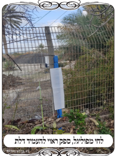
לחי מפולגיל, ספק ראוי להעמיד דלת

במתחם זה היה דבר מעניין שהצימרים היו מבנים קטנים עגולים, שאחרי שיש בפנים גם חדר שירותים, נשאר חדר קטן וצר, וא"כ כשאין