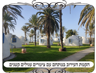
הקמת העירוב במתחם עם צימרים עגולים קטנים