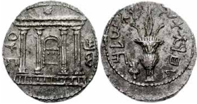
מטבע כסף שהוטבע מחדש על ידי המנהל הבר כוכביא בזמן מרד בר כוכבא. סלע - טטרדרכמה. משמאל: חזית בית מקדש וארון הברית בתוך, וכוכב מעל. מימין: לולב עם אתרוג, והכיתוב "לחרות ירושלים"

רבי עקיבא באמת חשב עליו שהוא מלך המשיח אבל 'כיוון שנהרג - נודע שאינו המשיח'. הכישלון שלו מצביע רק על דבר אחד, שהוא אינו מלך המשיח, אבל בהחלט הוא מלך טוב וכשר. הרמב"ם אומר את זה במפורש שאי הצלחה צבאית אין פירושה משיחיות שקר: 'בידוע זה שאינו זה שהבטיחה עליו תורה והרי הוא ככל מלכי בית דוד השלמים, הכשרים שמתו'. הרמב"ם לא שותף להעלמה שלו, לא להאשמה לנוכח הכישלון כי לא בוחנים ערך של מעשה רק לפי התוצאות הצבאיות, וגם לא כמי שהציג 'יהדות שרירים' חסרת אמונה כפי שמנסים להציג. הרמב"ם מציג את בר כוכבא כדוגמה של השראה".