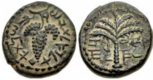
מטבע נוסף שהיה בשימוש בזמן המרד. משמאל: אשכול ענבים ולצדו הכתובת "שב לחר ישראל". מימין: עץ תמר והכתובת "אלעזר הכהן"

של הגלות אז היינו צריכים לפתח כישורים אחרים של למדנות ודבקות. העוצמה של כוח מבהילה. אני חושב שזה חלק מהעניין שלא רצו את דמותו של בר כוכבא שהביא עלינו אסון בגלל כוח, ויותר חמור – הוא הואשם שאף הפסיד את העולם הרוחני. בזירה הפוליטית של ימינו שני הקצוות האלה של אלו שחושבים שיש לנו יותר מדי כוח, ומצד שני אלו שחושבים שרק עולם רוחני הוא החשוב – נלחמים היום נגד דמותו של בר כוכבא. צריך לראות את בר כוכבא כפי שהוא. הוא לא מלך המשיח אבל הוא מלך כשר, שמעלה את ערך הגבורה והיוזמה וערכים חשובים, המאמץ לא נבחן רק על פי התוצאה. בסופו של דבר המציאות שלנו כאן – חשוב שנתסכל עליה בשיקול דעת וברצינות, צריך להכיר בכך שבלי הרבה אמונה לא היינו פה."