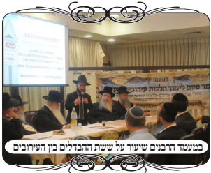
מנומרי הרבנים שיעור על ששת הדברים בין העירובים

הדברים האלו תמיד צריכים חיזוק, כאשר לא יודעים את ההלכות, קל להיכשל למעשה, כמו שר' משה אנגלרד אמר קודם, שגם את המפתח אי אפשר להוציא, וגם כשהמפתח נעוץ בחור הדלת, אסור לפתוח ולסגור את הדלת, כי נחשב שמוציא את המפתח. ועוד דוגמאות רבות. לכן חשוב מאוד שאברכים למדו את ההלכות האלו, ושיהיה חיזוק בענין העירוב, ושיזכו להצליח עם הלימוד שרכשו כאן.