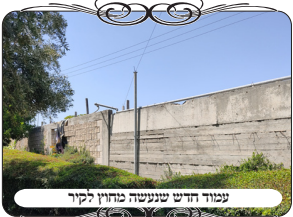
עמוד חדש שנעשה מחוץ לקיר

ביום חמישי הגענו יחד עם אחד מצוות העוסקים בתיקון העירובים, כדי לתקן דבר אחר בעיר, ופתאום האחראי מראה לנו גם את העמוד הזה, והסתפקנו מאוד איך לתקן אותו. במבט ראשון רצינו לעשות מה שכל הקוראים מיד אומרים, להעמיד לחי על הקיר מבחוץ, ואז הלחי הוא העמוד האמיתי מתחת החוט, כנהוג בעירובים שכונתיים, משום שזה תיקון קל יותר מאשר להביא עמוד חדש ולחבר אותו. אבל יש דבר חשוב שלומדים במסגרת השיעורים של מוקד העירוב, לא לעשות לחיים בעירובים עירוניים ובישובים, כי הם לא מבינים מספיק מהו ההיתר בלחי, ולא יודעים לכיון את הלחי תחת החוט. ואפילו אם נסביר להם ונעמיד את הלחי כעת במקום הנכון, יתכן שבהמשך החוט יקרע והוא יקשור אותו במקום אחר בקיר, ויסתמך על הלחי שנמצא לידו ולא מתחתיו, כי