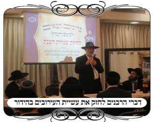
דברי הרבנים לחזק את עשיית העירובים בחידור

הגאון רבי בן ציון רוזנברג שליט"א רב ומו"ץ במרכז פ"ת , נשא דברים באחריות של הת"ח לדאוג שיהיה עירוב טוב, והביא באריכות את דברי הגמי (עירובין דף סח.) שהיה תינוק שהיו צריכים למול אותו בשבת, ונשפכו המים החמים שהכינו עבורו, אמר רבה שיביאו מים מהבית שלו, אמר לו אביי לא עשינו עירוב בחצר. אמר רבה נסמוך על השיתוף במבוי, אמר אביי גם שיתוף לא עשינו. אלא אמר להביא ע"י גוי, משום דהוי אמירה לנכרי באיסור שבות דרבנן