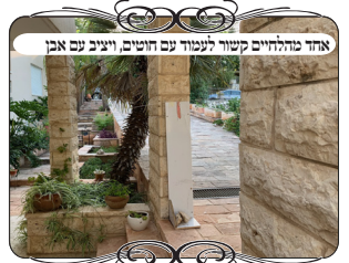
אחד מהחיים קשור לעמוד עם חוטים, ויציב עם אבן

בעשיית העירוב ברור שאינו כבניית לגו של ילדים, אלא צריך להשקיע כדי שיעמוד בכללי ההלכה, אבל זה נותן מענה די קל. נביא כאן כמה הלכות הנוגעות להקמת העירוב. א. גובה צורת הפתח אינו צריך שיהיה גבוה, אבל צריך לפחות חלל בגובה י' טפחים לכל אורך הפתח (עי' משנ"ב סי' שס"ג ס"ק צ"ד). בתחילה עשינו עמודים בגובה שני מטרים עם תושבת ברזל נשלפת, אבל כיון שזה ארוך אי אפשר לקחת אותו ברכב רגיל. מצד שני אם גובה העמוד יהיה מטר, מצוי שיש איזה מדרגה קטנה בקרקע לאורך החוט, והיא תמעט את החלל מי' טפחים. לכן עשינו גובה 1.20 מטר, שזה נכנס בקלות גם ברכב קטן, ובכל זאת מדרגה קטנה לא תפסול. ובדף ההוראות כתוב שצריך לבדוק שיש גובה מטר לכל אורך החוט.