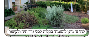
לחי זה ניתן להעמיד בקלות לפני גדר חיה ולקשור

ד. הבעיה העיקרית היא איך לחבר בלחיים אלו עשינו תושבת שמחוברת לחצי מצד אחד, ואפשר להניח עליה אבנים להחזיק את הלחי. והקפדנו שהתושבת תהיה נמוכה, והאבנים שיניחו יהיו עד עשרים ס"מ, כדי שלא יהיה חשש פתחי שימאי [תוך ג"ט לקרקע אין בעיה]. ועוד יותר יש לחשוש שהאבנים ייחשבו מבוטלים לקרקע, ואז מחשבים את הלחי רק מעל גובה האבנים, וצריך שישאר מטר בגובה הלחי מעל האבנים. וזה אחת מהסיבות שעשינו לחי בגובה מטר ועשרים, שיש אפשרות להניח אבנים כבדות בגובה עשרים ס"מ גם יש לחי משקל עצמי ששומר עליו.