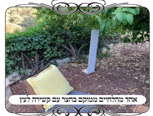
אחד מהחיים ממוקם בחצר עם קשורה לעץ

השבוע יצאה לדרך ערכה חדשה שהוכיחה את עצמה. דוקא הפעם הסיפור היה מעניין, שאדם ממוצא מחו"ל ויש לו בני משפחה שאינם דתיים, הוצרך להשתתף איתם בשבת בהתקבצות כל המשפחה באחד מהקיבוצים החילוניים, שהוא כבר ידע לומר שאין שם עירוב, הוא גם ידע לומר שהחצר אינה מוקפת בגדר, ועוד הוא הוסיף שסעודות השבת יתקיימו בחצר הפתוחה, והשאלה שלו איך מוקד העירוב יכול לעזור לו לשמור שבת בנתונים האלו.