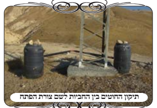
תיקון החוטים בין החביות לשם צורת הפתח

לאחר שמעמידים שני לחיים, יש בעיה של הרווח שביניהם, שהוא פירצה קטנה. אם מדובר בעמוד דק, יש לבדוק מהלחי לעמוד, ומהעמוד לחי שבצד השני, וזה מה שעושים בכל עירובי השכונות. אבל מי שמשמש בעמודי חשמל שהם רחבים, יש רווח גדול ביניהם, ואין לעמוד דין מחיצה, כי אין לבדוק בין הברזלים. לכן חייבים לסגור ביניהם. יש אפשרות לעשות גדר, או להעמיד משטחים [רפסודות], ויש אפשרות לקשור חוט מגג חבית אחת לגג החבית השנייה, ונוצרת צורת הפתח