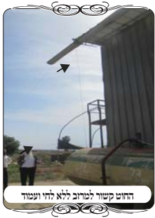
החוט קשור למרזב ללא לחי ועמוד