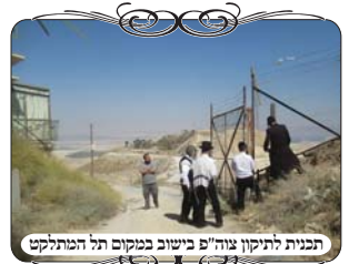
תכנית לתיקון צוה"פ ביישוב כמקום תל המתלקט

את זה רבים לא מוכנים לקבל. ליבם דוחק בהם לומר, הרי פעם היה פה מומחה שבדק את כל החביות, ומדוע לחשוש שישתנה משהו. אבל כל מי שמתמצא קצת יודע כמה פעמים עירוב משתנה בלי סיבה ידועה מראש, תאונות, עבודות עפר, תשתיות חדשות, ועוד. פשוט וברור שכמו שאין לסמוך על משגיח שאינו בקי בבדיקת המוצרים, כך אין לסמוך על בודק עירוב שאין לו את כל הידע המקצועי.