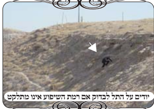
ידיים על התל לבדוק אם רמת השיפוע אינו מתלקט

ישוב נוסף שבדקנו שוב בשבוע שעבר, בעקבות קבוצה גדולה מהציבור החסידי שנסעה לישוב לשבת. בישוב זה אנו יודעים כבר כמה שנים על בעיות חמורות, ובעיקר הבעיה שקשה לפקח עליו נכון, כי הוא מורכב משני דברים בעייתיים מאוד, שגם בעירובים בכשרות הרבנות, יודעים היום שלא נכון להשתמש בדינים אלו, כי כמעט תמיד מוצאים שהם היו פסולים או שנויים במחלוקת. האחד הוא דין תל המתלקט, כאשר לא מדובר בצוק של סלע קשה, אלא שיפוע של הר או ערימת עפר, אי אפשר שיהיה כשר לאורך זמן, ויש לכך כמה סיבות א. בהרבה מקרים התברר שהשתנה מכפי שהיה בהתחלה כשהביאו ת"ח למדוד, ולא הבחינו בשינוי שאירע. ב. בהרבה מקרים מתברר שבקטעים מסוימים לא היה מספיק משופע, כי למראה עין זה נראה גבוה, אבל למעשה צריך שיפוע חזק יחסית. ג. בחיבורים בין התל להמשך המחיצות, יש הרבה פרצות שאוסרות, כי לא מספיק לחבר לתחילת השיפוע, כי המחיצה נוצרת מכולו וכאילו זו מחיצה נטויה, א"כ צריך שתמשיך המחיצה על התל לחבר לכל המחיצה, ועוד דינים רבים שאינם ידועים לאחראים, ואינם יכולים לבדוק את העירוב נכון, גם אם הם רוצים מאוד.