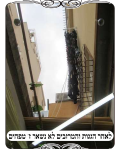
לאחר הגנת המרזבים לא נשארו טפחים

מטרים וברוחב 70 ס"מ, אבל לא לקחו בחשבון שאחרי שהשאירו חור 70 ס"מ, בא הקבלן ועשה גגון שמעליו יש מסגרת מפח שלא יכנסו גשמים, ורוחב המסגרת המקובלת כיום היא 15-20 ס"מ, יוצא שנשארו לו פחות מדי טפחים של סכך כשר. ואע"פ שפחות מג' טפחים של סכך פסול, כשר גם בסוכה קטנה ומצטרף להשלים (ש"ע סי' תרל"ב ס"א). אבל זה זוקא כשהמקום הפסול הוא פחות מג', משא"כ כאן שהוא פתוח לחדר, הורו הפוסקים שנחשב כהמשך של החדר, דהיינו שיש בו יותר מדי טפחים, ואי אפשר לצרף אף מעט ממנו. וא"כ הסוכה פסולה ממש.