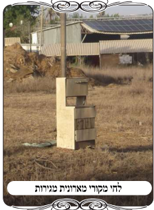
לחי מקורי מארזנית ענורות

בימי חול המועד באחד מהישובים שהגענו לפקח על הנעשה, היה מקום אחד שהחוט של העירוב היה תפוס מחוץ לרוחב העמוד, דהיינו מהצד, והערנו את הדבר לאחראי הבודק. הוא הבין את הבעיה, ואמר שיסדר אותה לפני שבת. לאחר מכן הוא אמר לנו שהעמיד לחי יפה. כשהגענו אחר כך לבדוק מה הוא עשה, ראינו שהוא העמיד