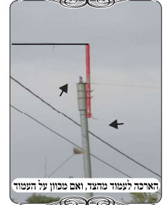
האריבה לעמוד נחבד, ואם מכיון על העמוד

שאלו המשתתפים, כיון שהקרש צמוד לעמוד חשמל, וגם היה עוד קרש צמוד מאחוריו, נאמר שהם המשך של העמוד עד הקרקע. והתשובה היא כפי שכבר הבאנו כמה פעמים בשם רבני זמנינו, שאי אפשר לומר המשך לעמוד אלא בדבר שממשיך מעל גביו של החלק התחתון, שאז המשקוף נחשב מעל העמוד שעל הקרקע, אבל בדבר שממשיך מהצד של העמוד, הרי זה עדיין מן הצד, המשקוף אינו מעל העמוד שמתחיל בקרקע, אלא על דבר שנמצא מצידו, וא"כ זה פסול [וגם למקילים בעמוד עקום, אך לא בשני עמודים זה בצד זה].