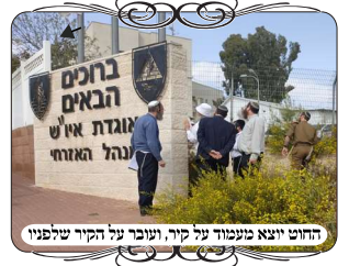
החוט יוצא מעמוד על קיר, ועובר על הקיר שלפניו

דבר נוסף שקשור לאותה הלכה אך בצורה אחרת, ומזה רואים כמה צריך ללמוד לפענח את ההלכות הבסיסיות הכתובות, ולהבין כמה מקרים שייכים לכל הלכה. בפתח של האגודה המחברת לעיר, שיש בה אנשי צבא והיא מוקפת גדר מסודרת, היה צורך לעשות צורת הפתח בכניסה, וקשרו את החוט מעל עמוד של סוף הגדר. כשהגענו לבדוק אותה, שמנו לב שהעמוד בעצם אינו מתחיל מהקרקע, כי הוא מחובר מעל קיר גבוה שני מטרים. שאלו הרבנים שהיו באותו מעמד, מה הבעיה שהעמוד יתחיל מעל הקיר, או לחילופין אולי הקיר יהיה העמוד. מוקד העירוב צריך להציג את המענה לכל השאלות, ולהביא את המקורות להלכות האקטואליות, שכאמור אינן כתובות מפורש בדוגמא כזו, אך רבני זמנינו לימדו אותנו כיצד הם דומים ושווים להלכות המפורשות. הנה אם העמוד על קיר [שאינו עליו שטח ד' על ד' טפחים] פסול משום שאינו עומד על קרקע, והקרקע היא למטה, והוא גבוה ממנה יותר מג' טפחים, [ועי' חז"א סי' ע"ס"ק י"ח]. והקיר אינו יכול להיות לחי, כפי שכתב המגן אברהם (סי' שס"ג ס"ק כ"ח) להוכיח מהמשנה הראשונה בעירובין, שקיר שיש עליו קורה, אינו צורת הפתח, [כי הוא ארוך ואינו דומה למזוזות הפתח]. אמנם אם יעבירו את החוט שיהיה בסוף הקיר, ויציא מעובי הקיר מהצד הקצר, כיון שזו צלע קצרה, אפשר להחשיב את עובי הקיר ללח.