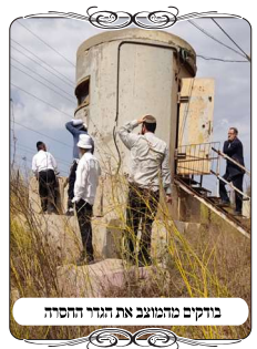
בדוקים מומלצים את הגדר החסרה

לאחר תיאום הגענו אל הישוב, עברנו יחד עם הרב ועם הבודקים העוסקים במלאכה, ובמקומות שהיו שאלות, הצענו אותם לפניהם עם המקורות, שיראו אם ובמה מומלץ לשנות, ולתקן יותר טוב. בעיר זו יש הרבה חלקים עם גדר בטחוניית, כיון שהם צמודים לעיר של פלסטינים שיצאו ממנה כמה מחבלים. ולכאורה היה סביר שאין מה