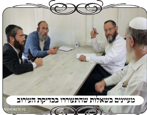
מעיינים בשאלות שהתעוררו בבדיקת העירוב

לבדוק, ובכל זאת היה לא מעט דברים לבדוק. דבר ראשון יש צדדים אחרים לעיר שבהם הערבים אינם סמוכים, ושם יש חלקים שאין גדר אלא צורת הפתח מעמודי חשמל וכדומה. וגם באזורים שצמודים לעיר הפלסטינית, אחרי בדיקה מקרוב התברר שיש כארבעים מטרים שאין גדר מסודרת.