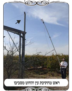
ראש חתיכת עץ והחוט מסביבו

אבל בעמוד שהוא הראה לנו לא היו מסמרים למעלה, או שהם היו נפלו, וכעת החוט היה קשור מסביב לחתיכת העץ, כיון שהוא היה בבעיה איך לקשור את החוט. אמרנו לו דוקא הדבר הזה הוא לא קטן, הוא