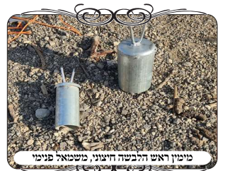
מיזיון ראש הלבשה חיצוני מונח בארץ פנימי

הרב קיבל את הדברים, ואמר שאם כן תחליפו פה את העמוד לעמוד חדש עם וי, אמרנו לו שיש לנו פתרון מיוחד לעמודים כאלו, שמלבישים להם ראש מברזל עם וי, ומחליפים רק את הראש. שאל הרב איך עולים למעלה לתקן, אמרנו לו שיש טכניקה לסדר את הראש בלי לטפס, אלא בעזרת מקל מיוחד ארוך. הרב שמח שיש כזה פתרון, וביקש שנעשה אותו. הגענו למקום עם הרכב של העירוב שיש בו את הציוד המתאים, ויש בו שלש סוגי הלבשות, כדי שיתאימו למגוון בעיות ועמודים שונים.