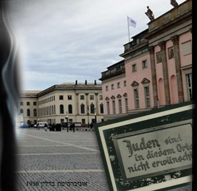
אוניברסיטת ברלין 1930