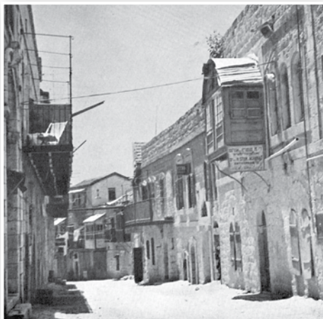
שכונת נחלת שבעה

אכן, בנתה חברה זו בתים רבים בירושלים. בין מייסדי השכונות הרבות שמחוץ לחומות העיר העתיקה, ומרחיבי גבול הישוב גם מחוץ לירושלים, היה בנו של רבינו – רבי בנימין בייניש. הוא נמנה על שבעת האברכים מבני הישיבות שהתאחדו במטרה לבנות להם בתים מחוץ לחומה. בראשונה הקימו את שכונת "נחלת שבעה" על שם שבעת האנשים שהתאחדו להקמת השכונה? 2 בעקבות שבעת הראשונים – באו רבים, ובשנת תרל"ב הגיע כבר מספר הבתים