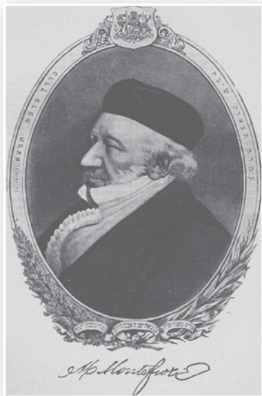
סר משה מונטיפיורי