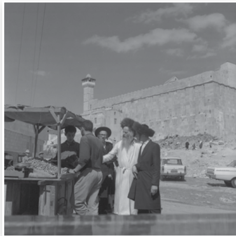
CC BY SA 4.0

והנה אנו, איננו חברי אגודת חובבי ציון, רק אלה המדברים גבוהה גבוהה על אהבת ארץ ישראל וחייבת ציון ובעצמם אינם מוכנים להיפרד מסיר הבשר, ואינם חושבים אף לרגע לעלות לארץ ישראל. הם הם חובבי ציון..." השליחים כבשו פניהם בקרקע, ולא ענו.