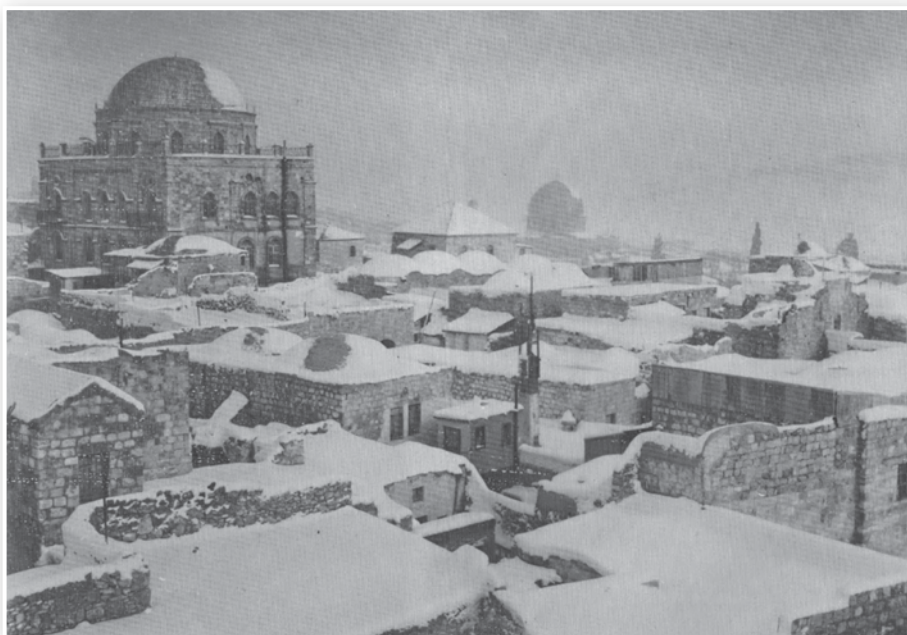
בית הכנסת תפארת ישראל לפני תש"ח, ביום שלג

כיום (תש"פ) מתבצעות עבודות שיחזור, ועמל רב נדרש על מנת להגיע לרמת שיחזור מרבית, שבית הכנסת החדש יהווה תעתיק מדויק של בית הכנסת שהוקם ב"ב באב תרל"ב. גובהו של בית הכנסת עתיד להיות מרשים בעז"ה, יהיה זה המבנה הגבוה ביותר ברחבי הרובע היהודי. כולנו מכירים את המבנה המרשים והגבוה של בית הכנסת "החורבה" המשוחזר, ובית הכנסת 'תפארת ישראל' יהיה גבוה בכמטר אחד יותר ממנו.