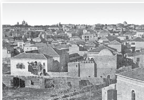
משמאל: שכונת בתי ניסן ב"ק ליד שער שכם למטה: בית הכנסת תפארת ישראל בבניינין, לפני שנחרב בתש"ח