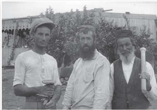
עובדי אדמה בבני ברק, תרפ"ה