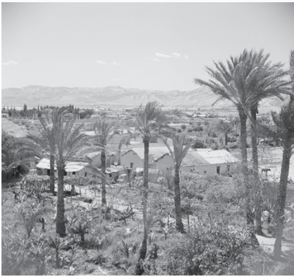
יריחו, שנת 1945

בין השנים תר"ל לתרל"ד, ניהלו ראשי העדה משא ומתן עם הפחה ומושל המחוז, בדבר קניית שטחי אדמה ביריחו 1 . כאשר באו לעמק השוה, היה הכרח לפי תנאי