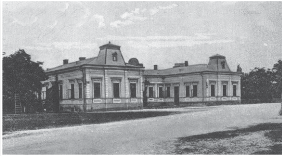
ביתו של רבי ישראל מרוז'ין בעיירה סדיגורא

ידועה היתה חיבתו של הרבי רבי ישראל מרוז'ין אבי שושלת בית רוז'ין (הכוללת את חסידות סדיגורא, צ'ורטקוב, הוסיאטין, בויאן, בוהוש ועוד), לארץ הקודש, אותה הוריש לצאצאיו. כל אדמו"רי בית רוז'ין נודעו בחיבתם הרבה לארץ וחלקם אף זכו לעלות ארצה לפני השואה (ראה לקמן בעובדות על האדמו"ר מסדיגורא).