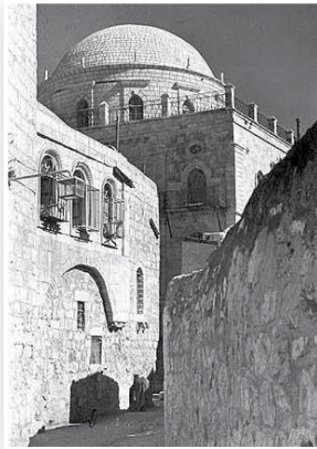
בית הכנסת תפארת ישראל

בנייתו של בית הכנסת התעכבה רבות, וניכר היטב עד כמה מתאמצים כוחות האופל לעכב את השלמת בנייתו לתלפיות. תוך כדי הכנת התוכניות והנחת היסודות, נסתלק הרבי מרוז'ין מהאי עלמא, ואת מקומו על כס ההנהגה בסדיגורה תפס בנו, מרן אדמו"ר הזקן רבי אברהם יעקב זיע"א. בימיו ובהשתדלותו הושלמה המלאכה, לאחר שנים ארוכות ורבות, ובית הכנסת המפואר הזה התנוסס על תילו. ותשלם המלאכה בשנת תרל"ב, ונקרא שם בית הכנסת "תפארת ישראל" על שם הסבא קדישא מרוז'ין.