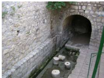
סע' מ - הרוצה לשאוב מים מהמקוה לנקותו...

והוא יחזקוהו סתם את מוצא מימי גיחון העליון ויישרם למטה מערכה לעיר ד'ודי ודברי הימים ב' ל'.