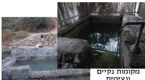
מקומות נקיים ונעימים

אנשים טובים מנקים את המעינות, וכל כך עוזרים ומקילים על ציבור הטובלים. יישר כחם.