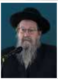
הרב בצלאל גינז

והיה ביום ההוא יתקע בשופר גדול ויבאו האבדים בארץ אשור והנדחים בארץ מצרים והשתחוו לה' בהר הקדש בירושלים