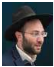
הרב חיים מאיר אינהורן