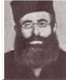
רבי ישראל מסטולין האדמו"ר מקרלין

בשנת תרפ"ח החליט הערבי בעל המקום למכור את החצר לכל המרבה במחיר. משפחת וינגרטן חפצו לגאול את המקום, וביקשו