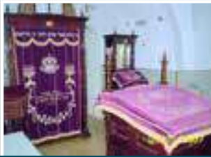
בית הכנסת אור החיים

"הנה אך למותר להוסיף ע"ד הרה"ג והצדיקים שליט"א המדברים בשבח יקר תפארת קדושת בית מדרשו וישיבתו של רבינו הקדוש מאורן של ישראל, מרן בעל אור החיים זי"ע ועל