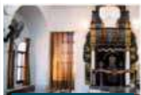
בית הכנסת העתיק של חסידי קרלין בטבריה

העתיק של רבי מנחם מנדל מוויטבסק שמתחת לבית הכנסת, ורבי אהרן שלח אליהם ספר תורה שסיים לכתוב, תיבה ועמוד תפילה מעץ.