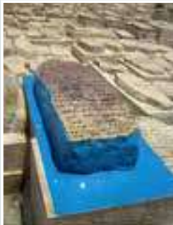
קבר האור החיים

כל ישראל, אשר ממנו תצא תורה לכל עדת ישראל ממזרח שמש ועד מבואו.