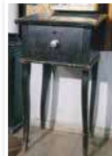
עמוד התפילה ששלח רבי אהרן מקרלין לטבריה

מסע, לפאר בית קדשנו ותפארתנו. מהראוי להיות לעזר ולסעד להם בעין יפה ורוח נדיבה. וע"י מקנת כספם יהיה חלקם בארץ החיים, במקום המקודש בעשר קדושות וכל ביה עשרה וכו'.