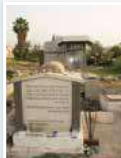
קבר רבי חיים אבולעפיה

בית כנסת זה קיים עד היום, בסמוך לכניסה לטיילת בטבריה הסמוכה לכנרת, ליד בית הכנסת חב"ד ובית הכנסת ר' חיים אבולעפיה.