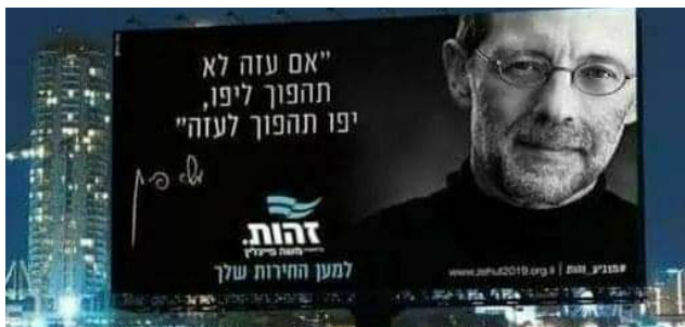
קמפיין זהות 2019 באייכון