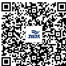
קישור לספרו של רלאנדי בספריה לאומית

מקורה של ההתיישבות הערבית שאנו מכירים כיום בעזה הוא ערב רב של פליטים ומהגרים, שאיבדו באופן סופי את זכותם להמשיך ולהתקיים במקום, כששמו להם למטרה, באמצעות ההנהגה שבחרו ברוב גדול, למחוק את מדינת ישראל מעל פני האדמה – ואף פעלו