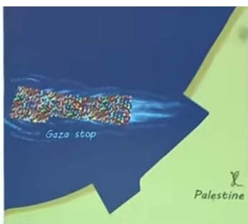
קריקטורה שפרסמו העזתיים בעצמם: כולם רוצים להגר

מאז עלות חמאס לשלטון עזבו את הרצועה כרבע מתושביה – רובם צעירים – ששילמו בין 5,000 ל 10,000 דולר עבור הזכות לצאת לאירופה תוך סיכון חייהם בסירות רעועות. המגמה הזו הלכה וצברה תאוצה במהירות ולא מן הנמנע שהיא שהביאה את חמאס להזדרז ולשנות את המשוואה הגאו-פוליטית, קודם שבעיית עזה תיפתר מעצמה.