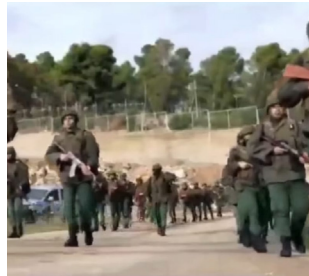
ארגון הטרור המכונה "הרשות הפלסטינית" מתאמן ביהודה ושומרון לקראת כיבוש יישובים ישראליים