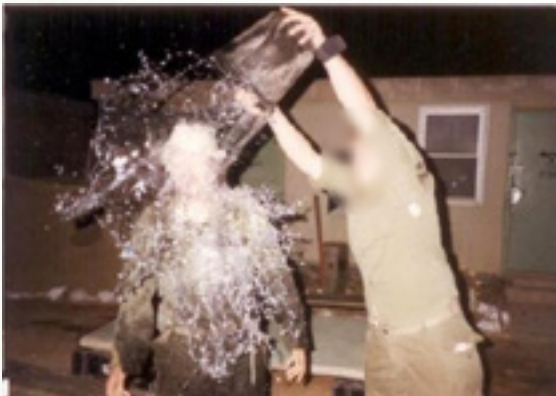
טקס חניכה 'זובור'